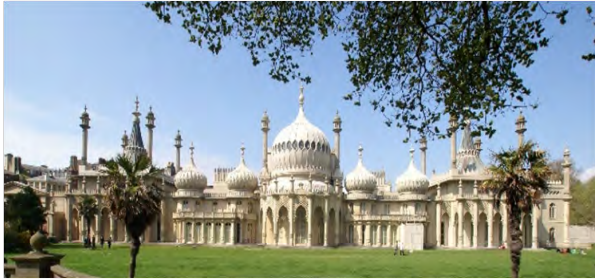
تصویر ۵: جان نش، رویال پابون، ۱۷۸۷ تا ۱۸۲۳ میلادی، انگلستان، ماخذ: URL4

نوع از حیثه تفکر می‌توان به رابرت موریس ۲۷ ، رابرت اسمیتسون ۲۸ و غیره نام برد.