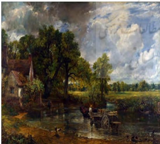
تصویر ۳: جان کانس‌تبل، گاری علفه، ۱۸۲۱، رنگ و روغن، ابعاد: ۱۳۰×۱۸۵ سانتی‌متر، نگارخانه ملی، لندن، ماخذ: URL3

هنرمندان در آن زمان به دوردست‌ها سفر کردند. آن‌ها شروع به طراحی نمودند و به مطالعه هنر نه در گالری‌های اروپایی بلکه در کوه‌ها و جنگل‌ها پرداختند. به عبارتی می‌توان گفت دست از دل‌مشغولی‌های روزمره کشیده و ترسیم‌کردن آن‌ها را به‌گونه‌ای رها کردند. به تعبیری شاید بتوان گفت این خصیصه رفتاری در هنر اسلامی نیز صورت گرفته است، برای مثال صنعت قالی که با گره بافته می‌شود و از بطن زندگی مردم صحرائشین سرچشمه گرفته است یا معماری آغازین صدر اسلام که به‌جای ستون از نخل‌ها استفاده می‌کردند، برخاسته از سبک زندگی صحرائشینان بوده است و این ارتباط انسان با طبیعت در جغرافیایی دیگر و با نگاه اورپانتالیستی ۱۷ و شرق‌انگارانه صورت گرفته است. نقاشان مشهوری چون جورج اینس ۱۸ منظر را وسیله‌ای برای حس کردن و