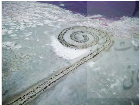
تصویر ۶: رابرت اسمیتسون، اسپایرال جتی، ۱۹۷۰، هنر خاکی، ابعاد: ۴۶ متر X ۴۶ متر، ایالات متحده

به نظر می‌رسد آثاری که در ارتباط با رمانتیسم خلق شده‌اند، آثاری هستند که ریشه‌های وحدت در آن‌ها یافت می‌شود و حس نوستالژیکی که در بین آن‌ها وجود دارد، ما را عمیقاً به رهیافت‌های مبنای وحدت وجود ارتباط می‌دهد که ریشه‌های آغازین آن را می‌توان در آراء اندیشمندان هنر و زیبایی‌شناسی اسلامی جستجو کرد. طبق مؤلفه‌هایی که در رمانتیسم وجود دارد، رمانتیک‌ها شرق را منبع غنی این موارد یافتند و همین یکی از مسائلی بود که موجب شکل‌گیری اورینتالیسم و شرق‌انگاری در غرب شد و این علاقه‌مندی به شرق، رابطه عمیقی بین مسئله وحدت وجود و ریشه‌های رمانتیسم برقرار می‌کند. بعد از دهه ۶۰ میلادی با توجه به اتفاقات اجتماعی-سیاسی‌ای که رخ داد، می‌توان جریان پویای جنبش رمانتیسم در بین هنرمندان را این‌گونه