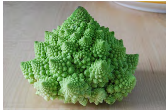
تصویر ۴: کلم رومی، وجود فراکتال در طبیعت، ماخذ: URL5

در آثار معماری تأثیری که بناها از دنیای شرق پذیرفته‌اند و این برآیند وحدت در عناصری که در طراحی‌هایشان حضور طبیعت مشهود بود؛ نشانه‌هایی از کثرت در وحدت را بازنمایی می‌کردند. این آثار و قیاس بصری آن‌ها با طبیعت موکل بر این گفتار است (تصویر ۴ و ۵).