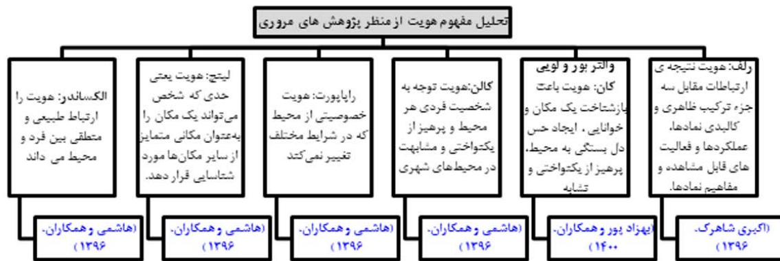
شکل ۱. مفاهیم هویت از منظر پژوهشگران Figure 1. Concepts of identity from the perspective of researchers