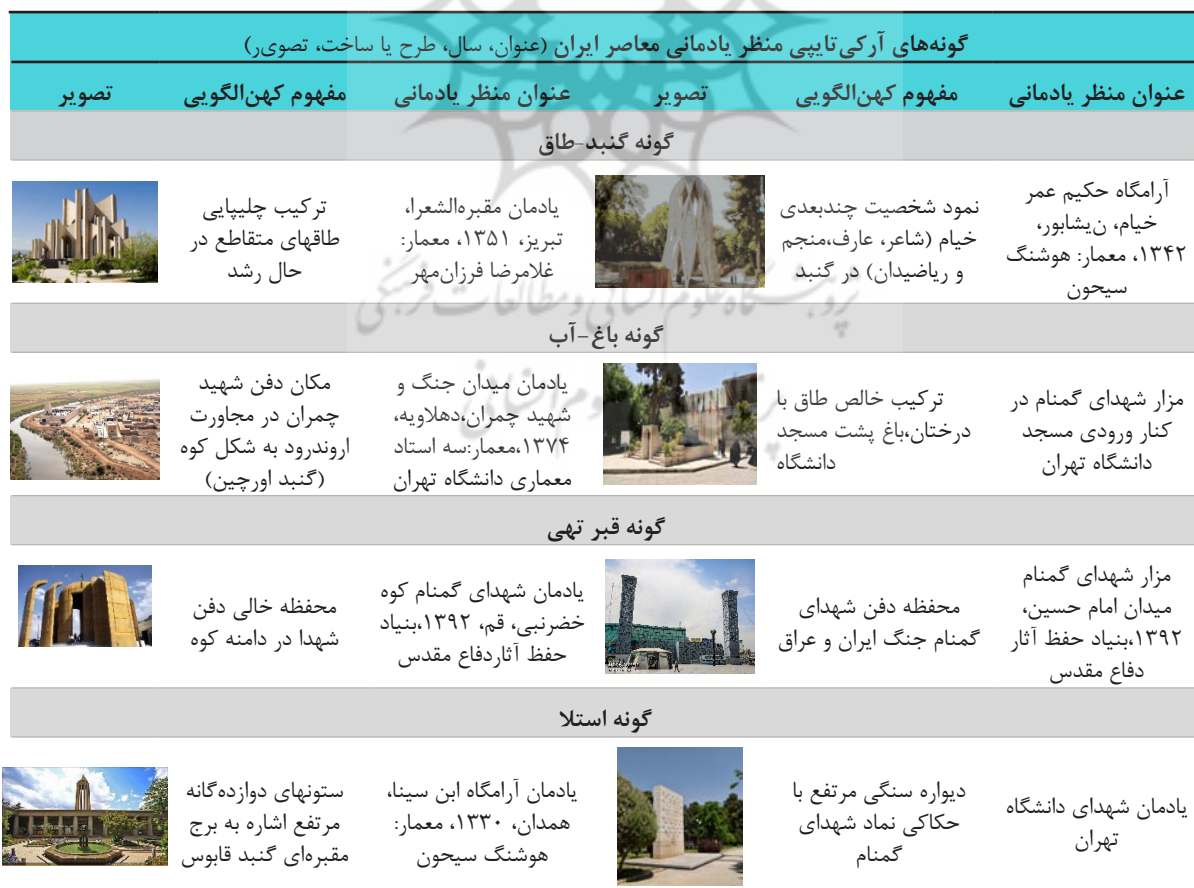
Table 2. Archetypal types of contemporary Iranian memorial landscape.

جدول ۲. گونه‌های کهن‌الگویی منظر یادمانی معاصر ایران.