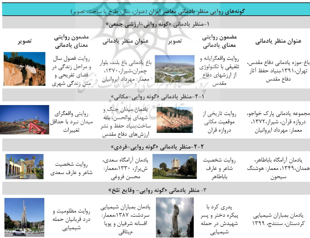
Table 3. Narrative types of the contemporary memorial landscape of Iran.