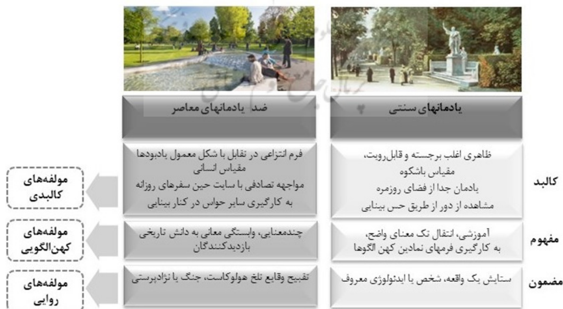
شکل ۱. مؤلفه‌های روایی، کالبدی و آرکی‌تایپی منظر یادمانی معاصر

در چند دهه اخیر در زمینه مطالعه یادمان‌های معاصر، اصطلاح «ضد-یادمان» ۹ با نوشته‌های جیمز یانگ ۱۰ در زمینه یادمان‌گرایی