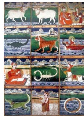
تصویر ۶: نشانه‌های زودیاک، قرن نوزدهم، هند، (URL5)

همانطور که در توضیحات جدول قید شده است، شباهت‌های بسیاری بین دو نگاره دیده می‌شود اما تفاوت بارزی که قابل ذکر است توصیه‌های موجود پزشکی در بعضی موارد جهت درمان قسمتی از بدن متفاوت می‌باشد. در ادامه باید این نکته را نیز قید کرد که نمادهای مورد بحث در هر دو کشور نیز متفاوت بوده و مورد بومی سازی قرار گرفته‌اند. در جدول بعدی به بررسی دو نگاره از ایران و دو نگاره از هند پرداخته شده که شباهت‌ها و تفاوت‌ها به صورت تفکیک شده از هم قرار گرفته‌اند.