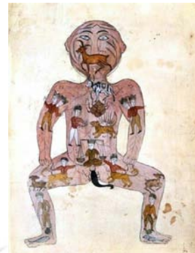
تصویر ۲: زودیاک-من، نسخه منتسب به خوارزمشاهی، جرجانی، ایران، (URL1)

به یکی از بروج متصل شده است احتمالاً هماهنگی فرد را با اتفاقات نجومی می‌رساند. در فضای خارج از دایره تصویر دو خورشید در سمت راست و چپ قرار دارد و در دو دایره پایین نیز تصویر ماهی و گاو شاخدار ترسیم شده است. در فضای زمینه که با رنگ لاجوردی رنگ شده طرح‌های اسلیمی به صورت خطی و با رنگ طلایی به هر چه بیشتر جلوه بخشیدن کمک کرده است.