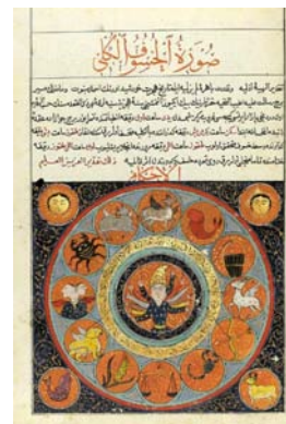
تصویر ۴: تقویم سلطنتی عثمانی برای سلطان عبدالمشید اول، محمد سعدالله، گواش و ورق طلا، ۱۹×۲۷ سانتی‌متر، ۱۲۶۰ هجری قمری، ۱۸۴۴ میلادی، ترکیه، (URL3)