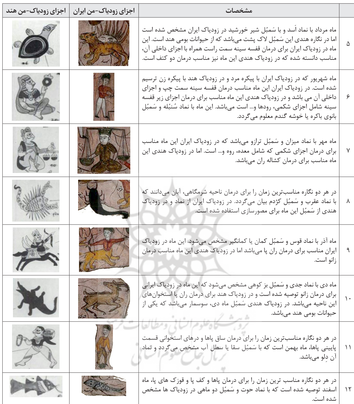
جدول ۲: بررسی تصویرسازی نگاره‌های منطقه البروج نسخه خطی و تقویم سلطنتی ایران، نگاره زودیاک وسوریا با هند(نگارندگان: ۱۴۰۰)