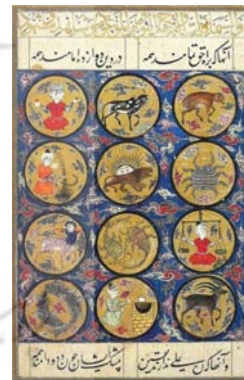
تصویر ۳: منطقه البروج، نسخه خطی، عراق، (URL2)