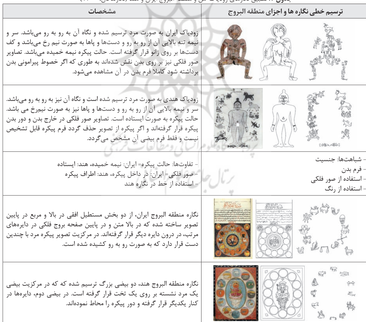
جدول ۳: تطبیق نگاره‌های زودیاک-من و منطقه البروج ایران و هند (نگارندگان، ۱۴۰۰)

در جدول ارائه شده، تصاویر نمادها به صورت تفکیک شده، روبه‌روی یکدیگر بر اساس اولین ماه تا آخرین ماه (= فروردین تا اسفند) درج شده و مورد بررسی و تطبیق قرار گرفته است. ابتدا باید عنوان کرد که نگارگران هر دو کشور بسیار زیبا به ترسیم منطقه البروج پرداخته‌اند. اما شباهت‌ها و تفاوت‌هایی که در هر دو نگاره وجود دارد فقط منوط به نحوه‌ی ترسیم و یا بازنمایی سَمبل‌ها نیست. بلکه نگارگران سعی کرده‌اند تا عقاید، محیط و فرهنگ جامعه خود را در تصاویر درج کنند که موفق هم بوده‌اند. در تصاویر می‌توان چهره‌ها و محیط پیرامون که اعم از گیاهان، حیوانات، اعتقادات، تزئینات، آرایش و پوشش فرهنگ را شامل می‌شود در تصویر مشاهده کرد که چگونه نگارگر به تصویر کشیده است. در تصاویر منطقه البروج مانند