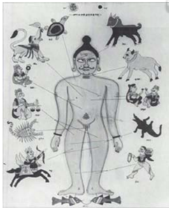
تصویر ۵: راسی پوروسا، نمودار دیوارهای یک ستاره‌شناس، تکنیک فرسک، گجرات، هند، (URL4)

در تصویری دیگر، نمادهای بروج فلکی بر خانه‌های مربع شکل در ردیف سه تایی افقی و چهار تایی عمودی قرار گرفته‌اند. تصویر زمینه هر دوازده خانه دارای یک موضوع با طبیعتی شامل: آب‌های پیچان سفیدو آبی توپر با زمینه سبز رنگ چمن و بوته‌های برگی شکل و رودخانه‌ای آبی رنگ و گل نیلوفر که نمادی از بوداست. رنگ غالب در تصویر سفید، قرمز، آبی و سبز است (تصویر ۶). در نگاره ای دیگر، سوریا یا حاکم هندی بر روی تختی نشسته که هفت اسب که به صورت پرسپکتیو مقامی کشیده شده‌اند آن را حمل می‌کنند و نشیمن گاه او، گل نیلوفر آبی است (تصویر ۷) پشت وی بالشت قطور استوانه‌ای شکل همراه با تکیه‌گاه و آفتاب‌گیر سلطنتی زمرد و یاقوت نشان تزئین گردیده. بروج فلکی هر کدام به صورت جداگانه در دایره منحصر به خودشان قرار داده شده‌اند. این تصویر دارای سه پس زمینه جداگانه است ابتدا آبی آسمانی همراه با کمی آبر در بالای تصور حاکم، دوم زمینه شیری رنگ برای بروج فلکی و سوم زمینه قرمز با برگ‌های سبز تیره.