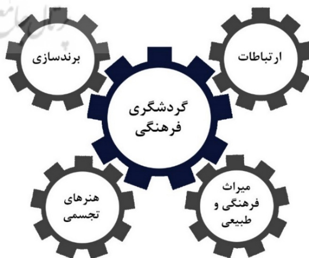
تصویر ۱. عوامل مؤثر بر گردشگری فرهنگی-مدل اولیه.

به‌طور کلی عوامل بسیاری در صنعت گردشگری فرهنگی نقش دارند و تعامل و ارتباط میان آن‌ها، گردشگری فرهنگی را میسر می‌سازد. از جمله این عوامل، که در تصویر ۱ نشان داده شده است، می‌توان به ارتباطات، برندسازی، میراث فرهنگی و طبیعی و هنرهای تجسمی اشاره کرد (Xu, 2020; Unesco, 2021; Manola, 2022). در ارتباط با تبیین شاخص‌های مدل اولیه (تصویر ۱)، ژو بر این باور است که گردشگری فرهنگی اولاً، تابعی از حجم گردشگر سالیانه‌ای است که به شهرها وارد می‌شود، ثانیاً بر شاخص‌هایی چون تعداد و کیفیت مراکز تجاری، به‌عنوان بسترهای ایجاد ارتباط اقتصادی و تعداد و کیفیت هتل‌ها به‌عنوان محل استقرار گردشگران استوار است (Zhou, Yang & Kim, 2020, 4). علاوه بر این از منظر یونسکو، کیفیت جشن و فستیوال‌های سالیانه نیز به‌عنوان فعالیت‌های فرهنگی و ایجاد ارتباطات فرهنگی، می‌تواند