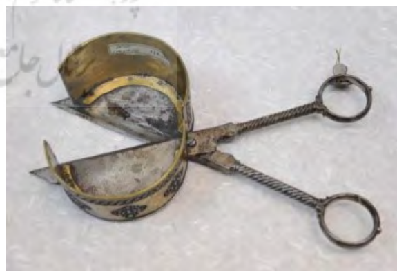
تصویر ۹- گل‌گیر (مقراض) فولادی صفوی با برج صفحه برنجی بر دیواره داخلی محفظه، طول ۲۹ سانتی‌متر.

«با تمام اهمیتی که شمع در قدیم داشته صنعت شمع‌سازی پیشرفته نبوده است زیرا نمی‌توانسته‌اند چربی لازم (از مواد مورد نیاز برای ساخت