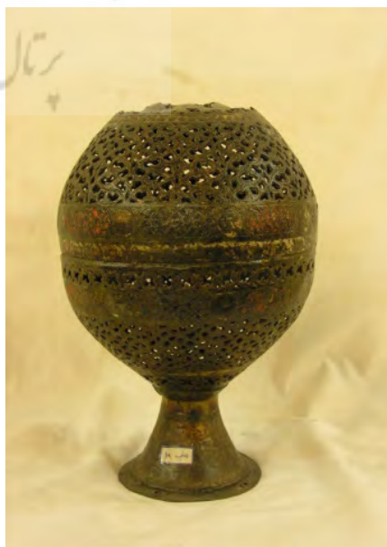
تصویر ۷- قندیل مفرغی مشبک دوره صفوی.