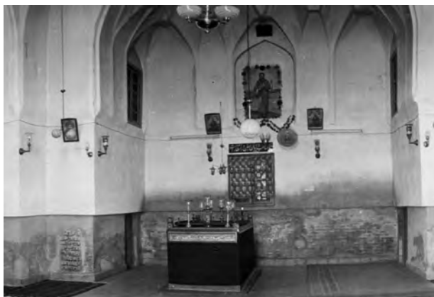
تصویر ۱- مقبره پیر پالان دوز، دوره پهلوی.

در راستای سیاست‌های مذهبی صفویان و نهادینه کردن مذهب تشیع در ایران، مقابر امامان و امامزادگان به‌عنوان مکانی برای اشاعه فرهنگ شیعی در مرکز توجه قرار گرفت. از جمله این اماکن، آستان مقدس امام رضا (ع) به‌عنوان تنها آرامگاه امامان شیعه در ایران بود. از پیامدهای این امر افزایش چشمگیر موقوفات و تعداد زائران حرم مطهر، توسعه و گسترش حرم رضوی و به طبع آن شکل‌گیری و توسعه تشکیلات اداری آستان قدس رضوی بود. از جمله ملزوماتی که در این دوره بسیار به آن توجه شد، تأمین روشنایی حرم بود. تعدد وقف‌نامه‌ها و اسناد اداری و مالی با موضوع روشنایی، وجود بخش‌های اداری منظم و مشاغل مختلف که وظیفه تأمین و مدیریت روشنایی حرم را بر عهده داشتند، نشان‌دهنده اهمیت و ضرورت این امر است. مستندات مرتبط با روشنایی حرم رضوی