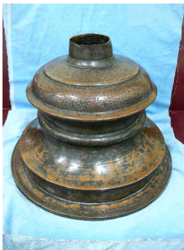
تصویر ۲- پایه شمعدان مسی، سنه ۸۶۳ ه.ق، ارتفاع ۳۹ سانتی‌متر.

همچنین اسکندربیک ترکمان در خصوص حمله عبدالؤمن خان ازبک به مشهد در سال ۹۹۸ هجری، مصادف با سومین سال جلوس شاه‌عباس اول می‌نویسد: «روضه مقدسه بباد غارت و تاراج رفت قنادیل مرصع و طلا و نقره و شمعدان که از حیز تعداد بیرون بود ... به دست ازبکان بی تمیز نادان درآمده آن گرانمایه را چون خرف ریزه بی‌بها به یکدیگر می‌فروختند» (همان، ۴۱۳). مجموعه این روایات نشان می‌دهد