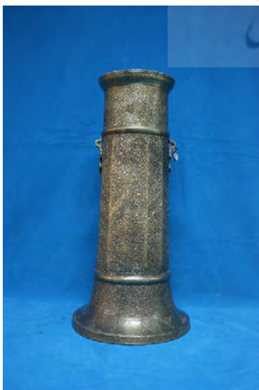
تصویر ۸- پیه‌سوز برنجی (پایه شمعدان) صفوی، قطر دهانه ۱۴ سانتی‌متر.