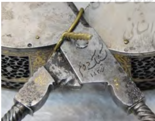
تصویر ۱۰- کتیبه کشیک دوم (دوم) بر روی گل‌گیر فولادی صفوی.

۵-چهل چراغ‌ها/لوسترها چهل چراغ و لوستر را می‌توان از انواع جارهای آویز محسوب کرد. جار، چراغ‌های چند شاخه به دو شکل زمینی یا پایه‌دار و آویز هستند که در انتهای هر شاخه محلی برای قرارگیری شمع تعبیه شده است (قدوسی، ۱۳۹۰، ۵۵). هر چند که اسامی چهل چراغ‌ها و لوسترها در اسناد صفوی آمده است اما به ندرت به مشخصات آنها اشاره شده است. در سند شماره ۳۲۱۶۸، به تاریخ ۱۰۶۹ قمری، از لوسترهایی با تزئینات «نقره خیاره‌دار» و «نقره کوب قبه‌دار» نام برده شده است. در برخی از موارد نیز به قطعات جانبی چهل چراغ‌ها مانند «سینی چهل چراغ» و در مواردی به مکان نصب آنها «چهل چراغ دارالسیاده» اشاره شده است.