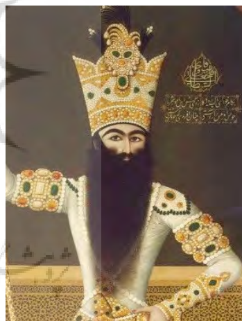
تصویر ۸- پیکره فتحعلی‌شاه قاجار، بخشی از اثر، نقاش: مهرعلی، ۱۸۱۰ میلادی، محل نگهداری موزه آرمنیاز.