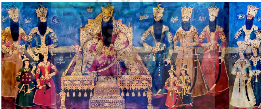
تصویر ۳- صف سلام فتحعلی‌شاه، میرزا محمدعلی نقاش، باغ موزه نگارستان، مأخذ: (URL2)

نگاه شاه از بالا به پایین، نشانه اقتدار حاکمیت و غلبه‌گی نگاه بر