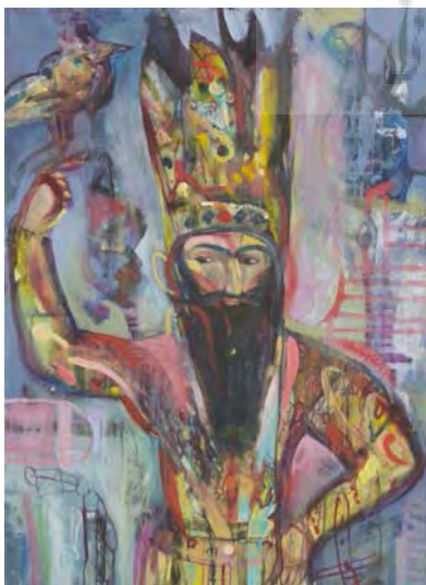
تصویر ۱۴- پیکره فتحعلیشاه قاجار، نمایشگاه رنگ رخسار، اثر: محمدعلی بنی‌اسدی