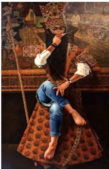
تصویر ۱۶- پیکره فتحعلیشاه قاجار، اثر: حامد صدر ارحامی.

بازی با خطوط و تبدیل آن‌ها به سطوح رنگی از ویژگی‌های بارز اثر حامد صدر ارحامی ۹ (تصویر ۱۶) است. به‌ویژه حضور خطوط مورب در اثر، تحرک مطلوب و متناسب با پیام و محتوای موضوع را آشکار ساخته است. فضای غالب بر تصویر فضایی نقاشانه و مملو از سایه‌سازی و نورپردازی است. علاوه بر این ترکیبی است از کاری سه‌بعدی حجم‌پردازی شده و فضایی نیمه‌تخت و تصویرسازانه نقاشی‌های قاجاری. در پس پیکره‌نمایی تندیس‌گونه اندام زنانه، پیکره نیمه تخت و پرطمطراق فتحعلی‌شاه، دیده می‌شود که خود در ابتدای تصویر و بدون عمق‌نمایی به تصویر کشیده شده است. این اثر ترکیبی از فضای تخت و سه‌بعدی است که با مهارت در هم آمیخته شده است. در پیش‌زمینه دست‌وپاهای اندام زنانه به چشم می‌آید و با توجه به اجرای هاپررئال آن، گویی کاملاً از سطح تابلو بیرون زده است. حجم‌پردازی و سایه‌پردازی توسط رنگ، با خلوص متفاوت، از