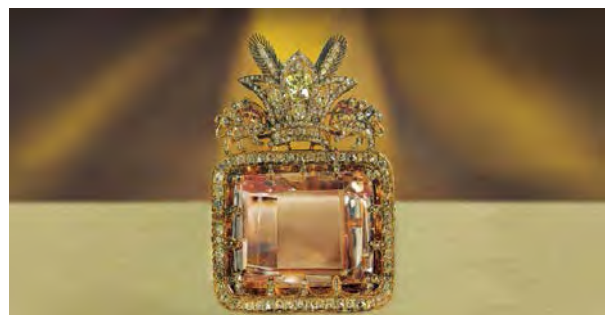
تصویر ۱۳- جواهر دریای نور، موزه جواهرات ملی