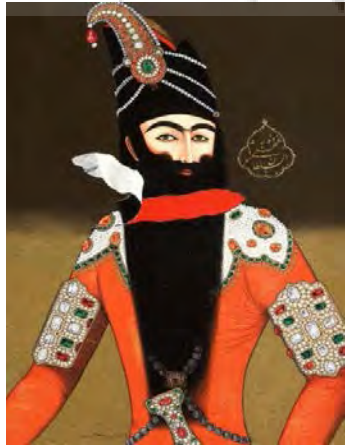
تصویر ۱۱- پیکره فتحعلی‌شاه قاجار، اثر: آیدین آغداشلو، از مجموعه خاطرات انهدام.