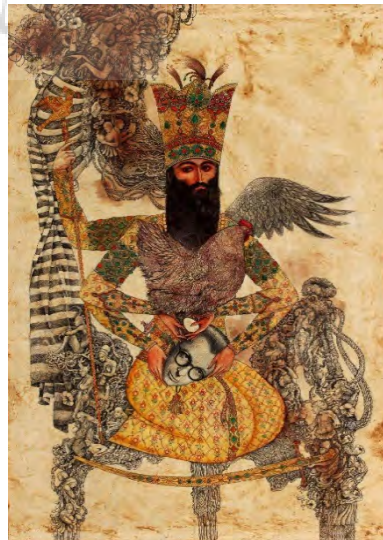
تصویر ۱۵- پیکره فتحعلی‌شاه قاجار، اثر: سعید خضایی.