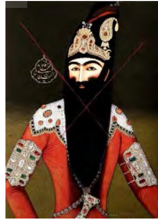
تصویر ۱۰- پیکره فتحعلی‌شاه قاجار، اثر: آیدین آغداشلو، از مجموعه خاطرات انهدام.