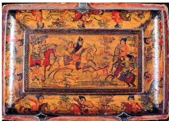
تصویر ۷- صندوقچه با طرح شکار فتحعلی‌شاه.

ارائه شوکت، جذابیت، زیبایی، ثروت و قدرت، نشان‌دادن شجاعت، مهارت و نیروی جوانی (تصویر ۷)، به نمایش گذاشتن عظمت خاندان قاجار و منصوب‌کردن خود به پادشاهان گذشته ایران را می‌توان از معانی ضمنی این پرترها دانست. در مجموع می‌توان گفت آثاری که با موضوع پیکره‌های فتحعلی‌شاه و به سفارش شخص او در دیواره کاخ‌ها خلق می‌شده این نکته را نشان می‌دهد که شاه از جنبه تبلیغاتی و سیاسی این آثار در عرصه داخلی و همچنین بین‌المللی بهره می‌برده و تنها هدف از ارائه آن تزئین کاخ‌ها نبوده است (رابی، ۱۳۸۴، ۵۱). در حقیقت این عمل در جهت اشاعه قدرت و نفوذ در اذهان و تأثیر بر افکار افراد تحت سلطه و دول خارجی تصاویر یا تک‌چهره خانواده سلطنتی به نمایش در می‌آمده است. این نقاشی‌ها گاه به‌عنوان تحفه و هدایا راهی دیار و کشورهای دیگر شده و جزو هدایای سلطنتی به سفرای اروپا به‌شمار می‌آمده است (مه‌دوی‌نژاد، ابراهیمی و مهیادی، ۱۳۹۰، ۴). به‌عنوان نمونه از میان ۲۵ تک‌چهره فتحعلی‌شاه که در حدود بیست سال کشیده شده‌اند، پانزده اثر به حکام هم‌عصر وی ارسال شده است. او تصاویری از خود را به شاهزاده هند اهدا نموده و پس از آن نیز بارها این هدایا و تحف را در طول حکمرانی خود برای او فرستاده است (رابی، ۱۳۸۴، ۱۵). ارائه تبلیغات و اطلاع‌رسانی قدرت و جبروت پادشاهی جهت تبلیغات داخلی و خارجی و ماندگاری در اذهان عمومی، کنترل افکار آنها با نمایش عظمت به‌نوعی بیانگر معنای ایدئولوژیک و فرهنگی این آثار هستند. در این قسمت به توضیح و تعریف ویژگی‌های صوری و سبکی در پیکره‌های فتحعلی‌شاه بر اساس تصاویر موجود در مقاله در جدول (۱) پرداختیم.