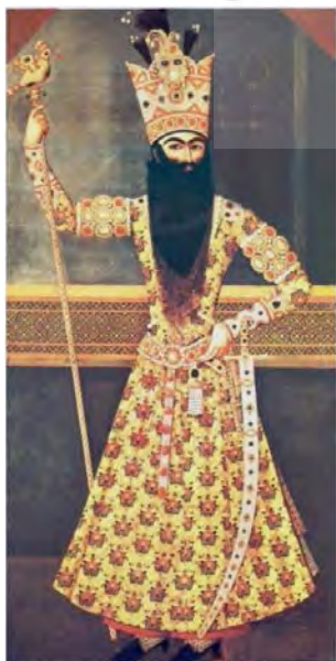
تصویر ۲- فتحعلی‌شاه، نقاش: مهرعلی، ۱۸۱۳ میلادی، موزه سعدآباد.

البته در بعضی از تصاویر مانند صحنه شکار، شاه جامه رزم بر تن دارد و چکمه چرمی به پا کرده است. کلاه مشکی و حالت‌دار قجرها را بر سر گذاشته، کمانی در دست گرفته و تیردانی به کمر بندش آویخته است.