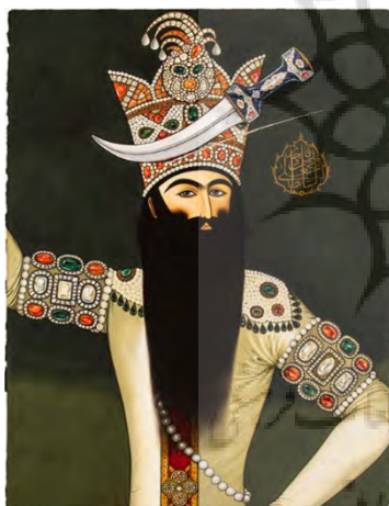
تصویر ۹- پیکره فتحعلی‌شاه قاجار، اثر: آیدین آغداشلو، از مجموعه خاطرات انهدام. مأخذ: (URL4)

به نظر این پژوهش‌آیدین آغداشلو با مجموعه انهدام (تصاویر ۹ تا ۱۲) به‌ویژه آنهایی که تصاویر درباری فتحعلی‌شاه را مخدوش می‌کند، نام سلطان را خط می‌زند (تصویر ۱۲) و روی تصویری از فتحعلی‌شاه به‌موازات سینه‌بند مرورید ضربدری‌اش علامت ضربدر می‌گذارد (تصویر