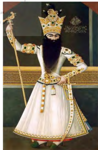
تصویر ۴- فتحعلی‌شاه با لباس شیری رنگ و بازوبند و کمربند لعل و زمره‌نشان، نقاش مهر علی، موزه ارمیتاژ، مأخذ: (دادور و نماز علی‌زاده، ۱۳۹۷: ۴۴)