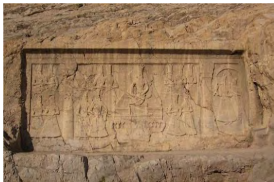
تصویر ۶- سنگ‌نگاره فتحعلی‌شاه معروف به نقش بر جسته چشمه‌علی واقع در چشمه‌علی شهر ری.