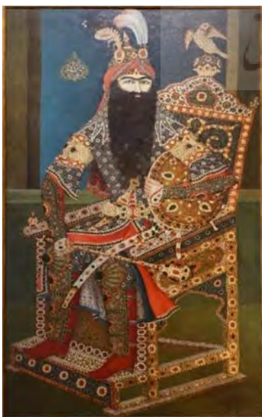
تصویر ۵- فتحعلی‌شاه قاجار، هنرمند نامشخص، موزه آقاخان تورتو، مأخذ: (URL3)