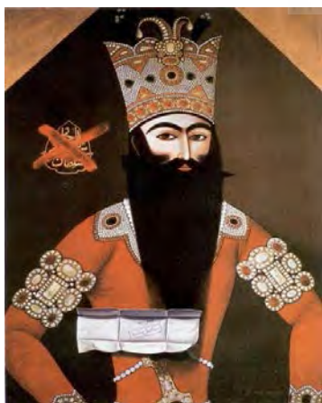
تصویر ۱۲- پیکره فتحعلی‌شاه قاجار، اثر: آیدین آغداشلو، از مجموعه خاطرات انهدام.