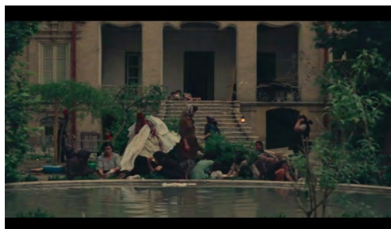
تصویر ۴- رخت‌شستن زنان و صحبت درباره‌ی خانه.