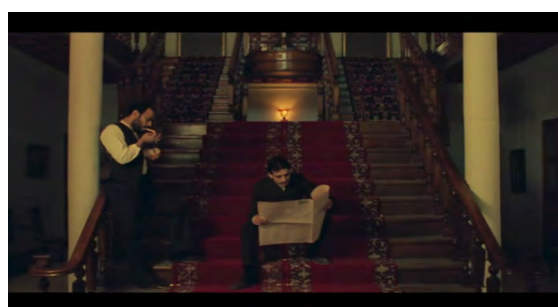
تصویر ۱- نقشه‌کشیدن برادرزاده‌ها برای به تصاحب‌درآوردن خانه در میانه پلکان.