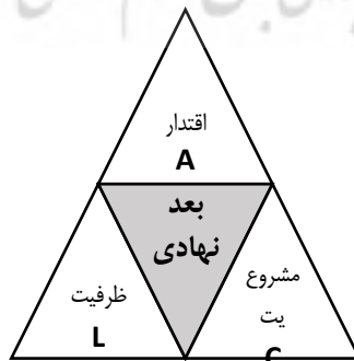
شکل ۲. سه بعد نهادی به‌عنوان انواع مختلف روابط دولت و جامعه

مشروعیت: شکست‌های مشروعیت در جایی رخ می‌دهد که دولت فاقد مشروعیت باشد. دولت ممکن است از حمایت محدود مردم برخوردار باشد. مشروعیت مربوط به نوعی روابط دولت و جامعه است که در آن جامعه خود فعال است، به این دلیل که آن را می‌پذیرد یا از پذیرش امتناع می‌ورزد، ادعای دولت تنها بازیگر مشروع برای تنظیم و اجرای قوانین به‌طور کلی الزام‌آور است. در راستای مفهوم‌سازی از مشروعیت به‌عنوان پذیرش قانون، بیشتر مشروعیت تجربی مدنظر است و نه مشروعیت هنجاری. شاخص‌ها (سرکوب، ترور سیاسی، شاخص آزادی مطبوعات، درصد رأی‌دهندگان وخیم شدن خدمات عمومی؛ تعلیق یا اجرای خودسرانه قانون؛ نقض گسترده حقوق بشر؛ ظهور نخبگان جناحی؛ مداخله عوامل سیاسی خارجی و دولت‌های خارجی) می‌باشند (سافران و سوگیارتو، ۲۰۱۴؛ استوارت و براون، ۲۰۱۰؛ گروینگهولت و همکاران، ۲۰۱۲؛ کارمنت و همکاران، ۲۰۱۰؛ کال، ۲۰۱۱؛ بوستی و همکاران، ۲۰۱۶؛ ابل و همکاران، ۲۰۱۶؛ کابروکا، ۲۰۱۵؛ رایس و پاتریک، ۲۰۰۸؛ سلی و دسوزا، ۲۰۱۹؛ دسیکوئرا، ۲۰۱۴؛ مارشال و کول، ۲۰۱۳؛ روتبرگ و همکاران، ۲۰۱۰؛ مکولین، ۲۰۱۶؛ گانسون و ونمن، ۲۰۱۸؛ اف.اس.آی، ۲۰۱۷).