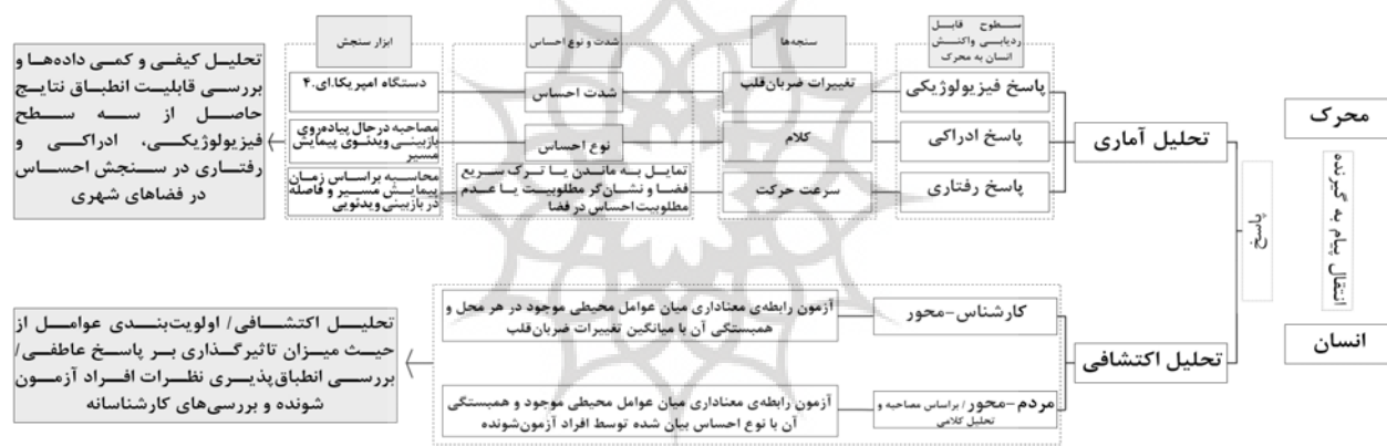
نمودار شماره ۱: چارچوب مفهومی پژوهش

با توجه به مطالبی که در بخش‌های قبل بیان شد، مشخص گردید