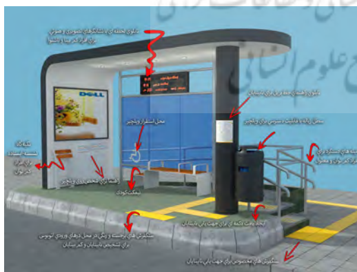
تصویر ۳. طراحی ایستگاه اتوبوس پیشنهادی.