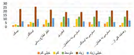
تصویر ۵. رضایت کارشناسان از طراحی‌های پیشنهادی (نفر).