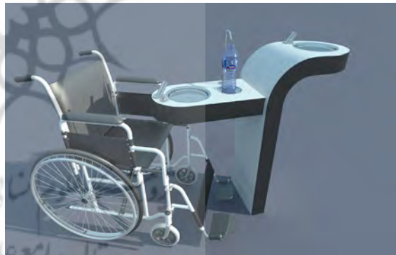
تصویر ۴. طراحی آبخوری های پیشنهادی.

طراحی ایستگاه های اتوبوس در نظر گرفته شود، بدین صورت می باشد: