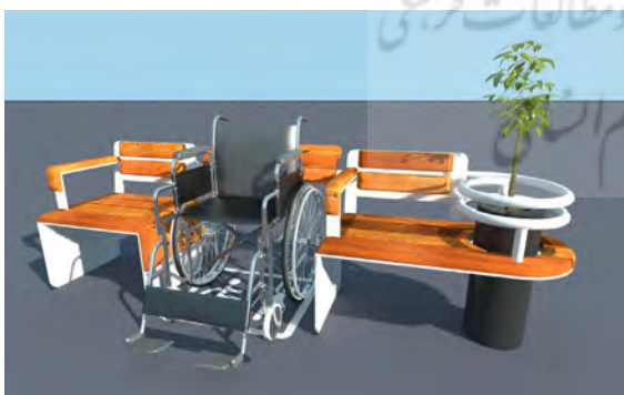
تصویر ۱. طراحی نیمکت های پیشنهادی.

همچنین ضوابط و مقررات پیشنهادی برای مناسب سازی نیمکت ها به صورت مندرج در جدول (۴) می باشد.