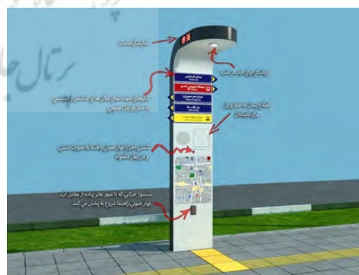
تصویر ۲. طراحی تابلوهای اطلاع‌رسانی پیشنهادی.