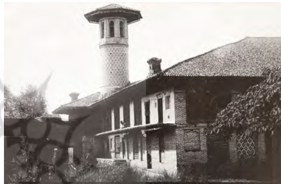
تصویر ۱۴. مسجد جامع، دوره قاجار، رشت.

۱۴). از اطلاعاتی موجود در تصویر (۷) نیز این گونه برمی‌آید که پیشینه‌ی عکاسی از ابنیه در دوره پهلوی اول جهت آگاهی و گزارش دادن همچنان متداول بوده و این مأموریت به دستور دولت بوده که توسط عکاسان اجرا می‌گردید.