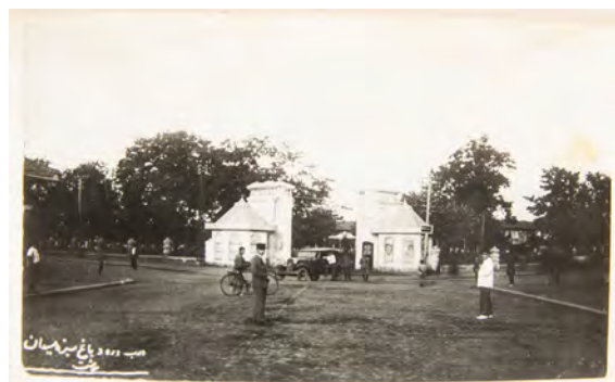
تصویر ۵. ورودی سبزه‌میدان، سال ۱۳۱۰، رشت.