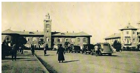
تصویر ۲. چشم‌انداز عمارت بلدییه، دوره‌ی پهلوی اول، رشت.

در تمامی تصاویر منظره شهری حضور انسان‌ها در شهر نمایان است و عکاس تشویشی برای ثبت انسان‌ها در تصاویرش ندارد و این شاهدهی بر پیشرفت فنی در دوربین‌هاست که برخلاف ادوار گذشته، عکاس برای تهیه عکس از ابنیه، به علت حساسیت پایین فیلم‌ها و حرکت انسان‌ها که باعث لرزش در عکس می‌شد، ملزم به خلوت نمودن صحنه‌ی عکس از