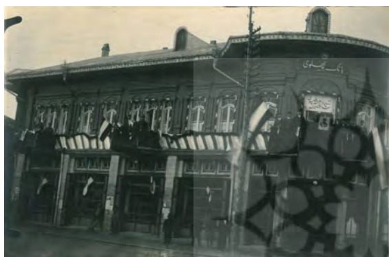
تصویر ۸. ساختمان بانک پهلوی، دوره‌ی پهلوی اول، رشت.

نمای ورودی و ساختمان‌های باشکوه سربازخانه‌ی رشت در تصویر (۱۱) به همراه قراول‌خانه که در آن دوران به سبک اروپایی ساخته شد، و دو برجک در ورودی این سربازخانه دیده می‌شود. این بنا نیز در روزگار خود از معماری بی‌رقیبی بهره می‌برد.