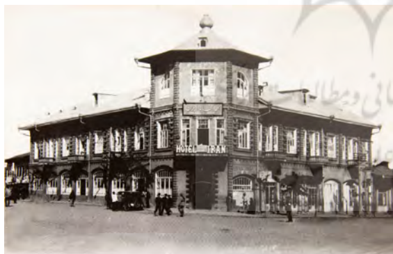
تصویر ۹. عمارت هتل ایران، دوره‌ی پهلوی اول، رشت.