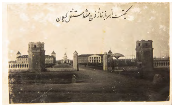
تصویر ۱۱. سربازخانه رشت، سال ۱۳۱۰.