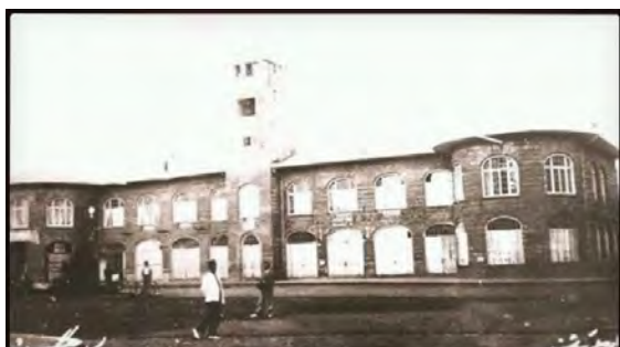
تصویر ۶. ساختمان شهرداری، عکاس: مسیو سورن، دوره‌ی پهلوی اول، رشت. منبع: (آرشیو آقای علیپور)