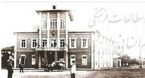
تصویر ۴. نمای مریضخانه بلدیه، عکاس: مسیو سورن، دوره‌ی پهلوی اول، رشت. منبع: (آرشیو کیوان پندی)

به موازات نوسازی شهر رشت، عکاسی معماری هم‌راستا با این جریان بسیار رایج گشت. در تصاویر (۴ تا ۶) که توسط مسیو سورن، عکاس ارمنی تهیه گردیده، همواره دو فرد، یکی با کت و شلوار تیره و دیگری با کت و شلوار سفید در عکس‌ها مشاهده می‌شوند. کت و شلوار به‌عنوان سبک پوشش جدید، بخشی از سیاست‌های تجدیدطلبانه حکومت وقت بود. در کتاب «عکاسان و عکاسخانه‌های گیلان» چنین آمده که احتمال می‌رود یکی از این افراد داخل عکس، مسیو سورن باشد. اگرچه این گمان هم وجود دارد که او از دستیاران خود در عکس‌ها بهره می‌برده و نشانی از خود به‌عنوان عکاس برجای می‌گذاشته که اکنون این تصاویر مبدل به امضای مسیو سورن گشته است. اگرچه تعداد کمی تصاویر از این عکاس در دست می‌باشد، اما طبق اسناد موجود می‌توان این گونه تحلیل نمود که مرکز توجه مسیو سورن و بسیاری از دیگر عکاسان در این زمان، عکاسی از معماری، بافت شهری و معرفی یک بنای خاص همچون ساختمان پست،