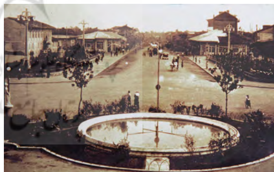
تصویر ۳. منظره‌ی میدان بلدیه، سال ۱۳۱۳، رشت.