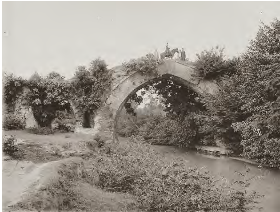
تصویر ۱۳. پل کاروانرو، دوره قاجار، رشت.

وجود طبیعت زیبای شهر رشت، عکاسان داخلی اشتیاقی برای ثبت این گونه تصاویر نداشتند که گمان می‌رود ناشی از خواست حاکمیت موجود برای نشان دادن توسعه و تجدد شهری بوده است.