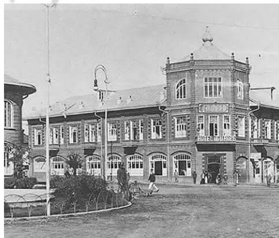
تصویر ۱۰. منظره هتل ایران قدیم یا مهمانخانه اروپا، دوره‌ی پهلوی اول، رشت.