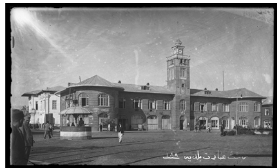
تصویر ۱. عمارت بلدییه، دوره‌ی پهلوی اول، رشت.

اولین سفارش‌هایی که به عکاسخانه‌ها داده می‌شد، چاپ عکس برای اوراق شناسایی و گواهی‌نامه‌هایی بود که واحدهای مختلف حکومتی صادر می‌کردند. در حقیقت عکس گرفتن برای اوراق شناسایی، سال‌های سال بخش عمده‌ای از کار عکاسخانه‌های عمومی را تشکیل می‌داد.