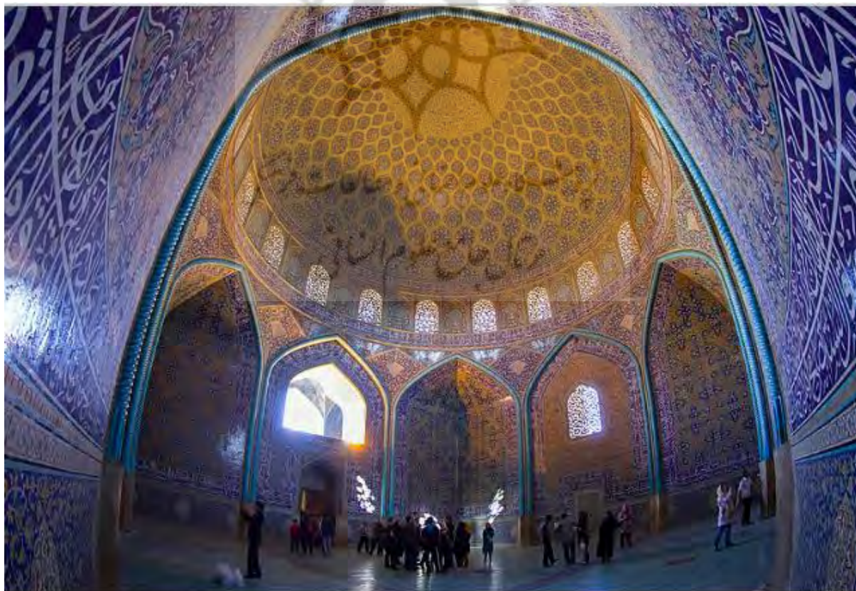
تصویر ۱- نمایی از فضای درونی گنبد مسجد شیخ لطف‌الله. دوره صفویه. اصفهان.

یکی از درون‌مایه‌های بنیادی و گسترده شعر فارسی و ادب صوفیه، مسئله تقابل عقل و عشق است. امیرخسرو عقل را به عقل ایمانی و عقل یونانی تقسیم می‌کند. عقل ایمانی را هم‌پای عشق می‌ستاید و مدح می‌کند و از نظر او عقل یونانی سیه‌نامه است و باید در برابر عظمت و منزلت طفل دبستان عشق اشک ندامت ببارد. عقل مرد میدان عشق نیست. عشق چون عقابی است پر صولت که گنجشک عقل را جرأت نزدیک شدن به آن نیست. عشق را چونان شرابی پرزور و خرد (یونانی) را در برابر عشق قرار می‌دهد و آن را خام و فرومایه خطاب می‌کند و هشدار می‌دهد که در برابر آستان مقدس عشق باید ادیش را حفظ کند. در ساختارها و تزئینات مسجد شیخ لطف‌الله نیز مسئله وحدت در عین کثرت دیده می‌شود.