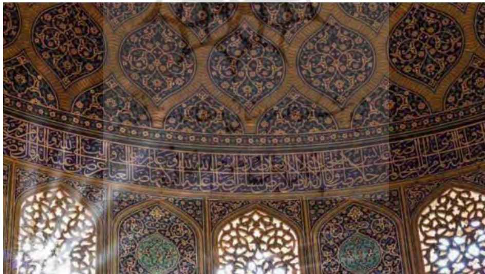
تصویر ۳- ترکیب نور و نقوش گیاهی و کتیبه‌ای در مسجد شیخ لطف‌الله. اصفهان. دوره صفوی.

این ترکیب نمایان‌گر وحد در عین کثرت است.