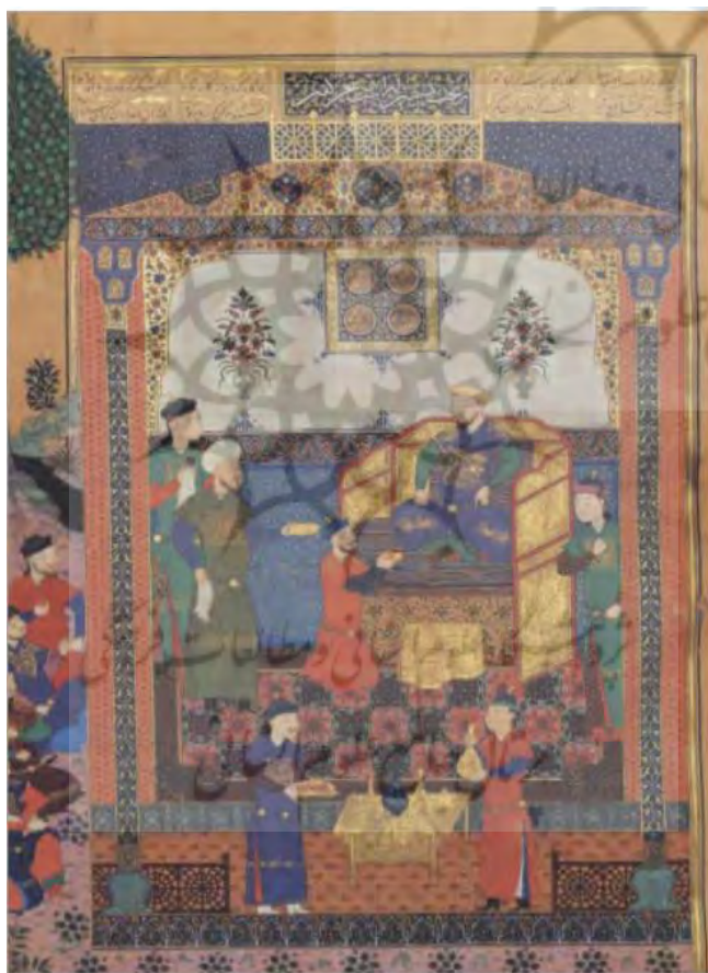
تصویر ۱. نگاره بر تخت نشستن لهراسب، شاهنامه ۸۴۴ تیموری محفوظ در کتابخانه ملی پاریس.

از آن پس، دیگر نامی از لهراسب در شاهنامه نیست تا زمانی که کیخسرو با پیام سروش، دعاهای خود را برای رفتن به بارگاه خداوندی پذیرفته دید. کیخسرو پس از عهد و منثور دادن به رستم، گیو و طوس، بیژن را به سوی لهراسب فرستاد و او را فراخواند. با رسیدن وی، خود از تخت برخاست و تاج بر سر نهاد و او را شاه آینده ایران خواند. در شاهنامه تیموری محفوظ در کتابخانه پاریس نیز با آوردن نگاره بر تخت نشستن لهراسب این مسئله تأیید شده است. تصویر شماره ۱ به این موضوع اشاره دارد.