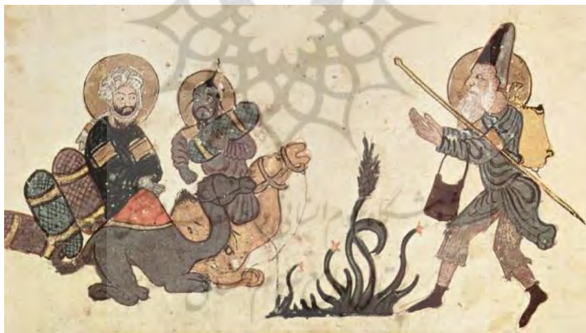
تصویر ۴: ابوزید در سفر حج، مقامات حریری، مکتب بغداد. کتابخانه ملی پاریس.

پس مال و ثروت تحت سلطه ارزش‌های عمومی قرار گرفت و به همین دلیل مردم به دنبال پول شتافتند و به طرق مختلف به آن چسبیدند، نه دین مانع آن‌ها شد و نه هیچ عامل بازدارنده دیگری. در مورد ترکیب جامعه عرب در آن زمان، جامعه عباسی به سه طبقه تقسیم می‌شد: (طبقه اصلی که شامل پادشاهان، شاهزادگان، وزرا، رهبران، والیان و دولت‌مردان ارشد بود و طبقه وسط که شامل علما، اهل ادب، خوانندگان، بازرگانان و کارمندان دولت بود و طبقه عامه مردم که طبقه وسیع و بزرگی بود و دهقانان و پیشه‌وران و مستمندان و مستضعفین را شامل می‌شد). طبقه حکام از زندگی آرام و رفاه و لذت‌های زندگی متمدن جدید بهره می‌بردند، این افراد مرفه تمایل داشتند هر چیزی را که مکمل حکومت و زندگی آرام آن‌ها باشد، مانند بردگان، کنیزان و قصرها به دست آورند (موسوی، ۲۰۰۵: ۱۵). در نگاره‌های مربوط به دوره عباسیان نیز می‌توان نمود زندگی اجتماعی و اقتصادی افراد را به روشنی مشاهده کرد. در عین حال در این نگاره‌ها عواطفی چون امید و خشم و حیرت دیده می‌شود. تصویر شماره ۴ نمونه‌ای از این تصاویر است.