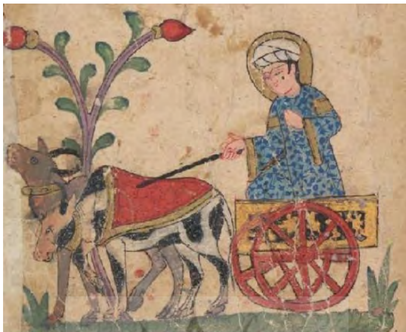
تصویر ۳: نگاره‌ای از نسخه مصور کلیله و دمنه، مکتب بغداد. نسخه کتابخانه ملی پاریس