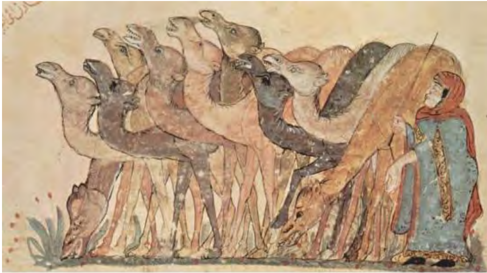
تصویر ۲: نگاره شتران در نسخه کلیله و دمنه. مکتب بغداد، کتابخانه ملی پاریس.

همان‌طور که فاتن علی می‌گوید، خزاعی از تصاویر حیوانات به‌عنوان یک نماد برای معانی خاصی استفاده می‌کند: و نام برخی از حیوانات در شعر دعبل، به‌ویژه در هجوهای او تکرار شده است، نه برای وصف آن‌ها بلکه این امر برای حذف صفت انسانی است که بر روی آن‌هاست، یا بخشیدن برخی از خصوصیات این حیوانات به ممدوح، یا استخراج حکمت از آن‌هاست، گاه استفاده از تصاویر حیوانات برای نشان دادن حالت روانی خودش است، پس این تکرار مانند پژواک مکنونات درونی اوست و احساسات و عواطف روح او را در مقایسه با آنچه ذکر و ترسیم می‌شود در مخاطب برانگیزاند (فاتن علی، ۲۰۱۳: ۱۲۵).