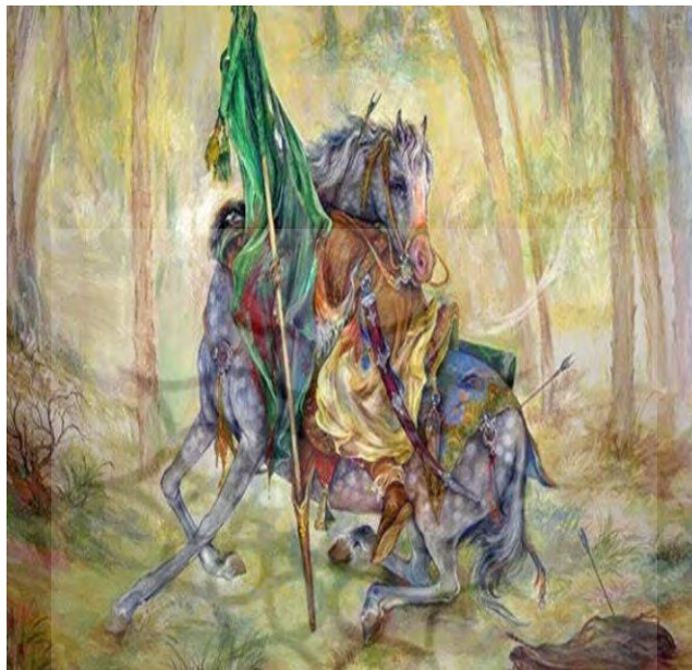
تصویر ۳: نگاره شهادت، اثر استاد محمود فرشچیان.

هم کشته شدند». «قربانی برای یک انقلاب بزرگ نشانه‌ی یک پیروزی و نزدیک شدن به هدف است. بی جهت نیست که درباره‌ی سید شهدای جهان، منقول است که هر چه یاران بزرگوارش از دست می‌رفتند و هر چه ظهر عاشورا نزدیک تر می‌شد، رنگ مبارکش افروخته‌تر و ابتهاجش زیادتر می‌شد. هر شهیدی که می‌داد، یک قدم به پیروزی نزدیک تر می‌شد. مقصد عقیده است و جهاد در راه آن و پیروزی انقلاب، نه زندگی دنیا و رنگ و بوی ننگین آن. این شهادت هاست که به ملت وعده‌ی پیروزی نهایی می‌دهد. مگر اسلام از شهادت ۷۲ تن برگزیدگان خدا در حکومت جبار بنی‌امیه خسارت دید؟» (همان: ۳۶۷/۱۶-۳۶۸).