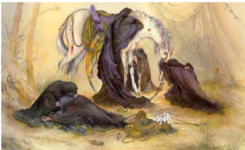
تصویر ۲: واقعه عاشورا. اثر استاد محمود فرشچیان. دوره معاصر.