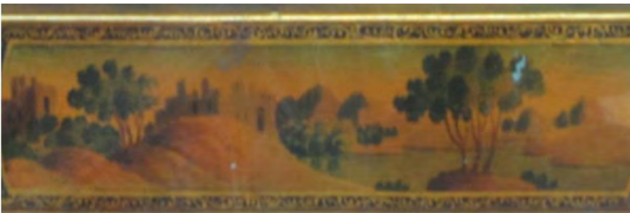
تصویر ۱: بخشی از ترسیم طبیعت در نمای قلمدان لاک. دوره قاجار.

عشق به مفاهیم ارزشی در بوف کور از طریق ستایش زیبایی‌ها و پاکی در وجود یک زن به‌خوبی توصیه نمایان شده و تلاشی را که در پی مرگ او برای احیای دوباره او دارد که نشانی از پیوند های اصیل یک انسان شرقی به هویت فرهنگی و بومی خویش است.