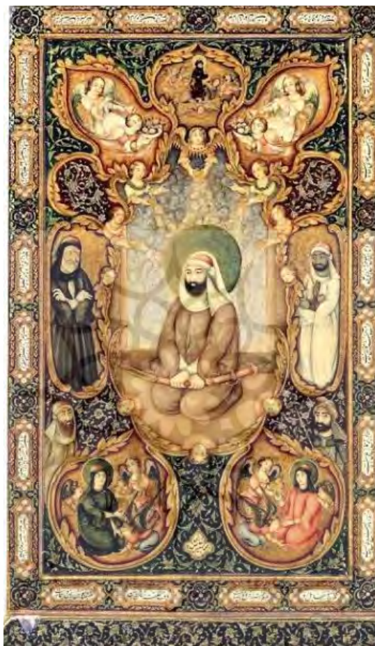
تصویر ۴. نمونه نقاشی در قاب آئینه لاک‌ی. محمد اسماعیل اصفهانی. دوره قاجار.

استفاده می‌کرد سال‌ها قبل از ورود جریان رسمی و آشکار ادبیات پست‌مدرن در ایران بود ولی او در آثارش توانست که ویژگی‌های بسیاری از تکنیک‌های پسامدرنیستی را به کار برد. رمان «ملکوت» از او بیانگر اندیشه‌های فلسفی انسان نسبت به عالم آفرینش است. با این آیه از قرآن «فَبَشِّرْهُمْ بِعَذَابِ الیم» شروع می‌شود که در مقام انذار و طعن به کافران ذکر شده است.