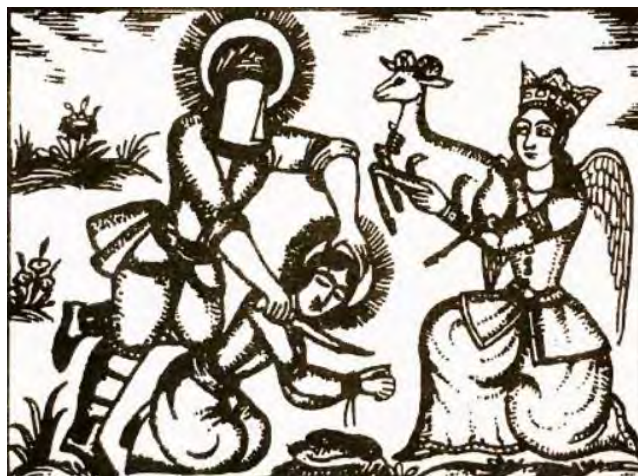
تصویر ۳: دستور جبرئیل به حضرت ابراهیم. (مأخذ: مارزلف: ۱۳۹۸).

ادغام تصاویر کهن از فرشته با سبک پوش و نقاشی غربی را می‌توان نوعی پست مدرنیسم در نقاشی این دوره دانست. اگرچه این جریان در دو دههٔ اخیر به دلیل عدم برخورداری نویسندگان از اطلاعات وسیع تاریخی، فرهنگی و روانشناسی که لازمه کار در این سبک بوده سیر نزولی داشت، اما در مجموع آنچه حق مطلب در این زمینه ایجاب می‌کند اینکه آثار پست مدرنیستی در ایران چون نیازی مبرم در درک و بیان واقعیت‌ها و حقایق زندگی انسان مطرح بود که بیانگر افکار و اندیشه‌های او از مجموع رویدادهای حاصله و معضلات بشری به همراه بیدارسازی و آگاهی او با فنون ادبی روز دنیا، همگام با نویسندگان مطرح پست مدرنیستی جهان پا به عرصه وجود نهاد که از طریق ایجاد پیوند با عمیق‌ترین و اصیل‌ترین اندیشه‌ها و احساسات بشری چون عشق، امید، تلاش، بقا، استقلال، نوع‌دوستی، هدفمندی و رشد مستمر در مسیر تکامل فردی و اجتماعی توانست که گام‌های مؤثری در جهت غنای ادبی و حفظ و رشد فرهنگ ملی همگام با نمونه‌های غربی در پاسخ‌گویی به نیازهای بشری دارد.