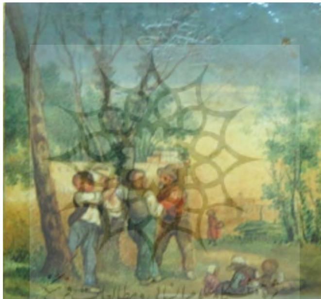
تصویر ۲. ترسیم شور زندگی در نقاشی‌های دوره معاصر.

رمان نوعی از اشکال ادبی، مظهر بیان عواطف، آرمان‌ها، نیازها و آرزوهای انسان بوده است. قالبی که همپای تحولات زمان تحول و تکامل یافته و علاوه بر انعکاس واقعیات دنیای خارج، تبلور اندیشه‌ها و دیدگاه‌های دنیای درون بوده است. نوعی منحصر به فرد از انواع ادبی که با کاربست فنون و تکنیک‌های نوین ادبی در زمان تلاش در بهبود شرایط زندگی انسان و افکار و اندیشه‌های او که در پیوند منطقی با فرهنگ و تاریخ گذشته داشته صورت گرفته است. رمان پست‌مدرن به‌عنوان شکل نهایی رمان در عصر حاضر علاوه بر نشان دادن ضعف‌ها و کاستی‌ها تلاش در انعکاس ابعاد پنهان زندگی او داشته است که از این طریق سعی در تنبه و بیدارسازی او در رسیدن به حقوق و جایگاه انسانی او بوده است. در نقاشی‌های پست‌مدرن معاصر نیز به وفور ترسیم زندگی روزمره دیده می‌شود. تصویر شماره ۲ نمونه‌ای از این تصاویر است.