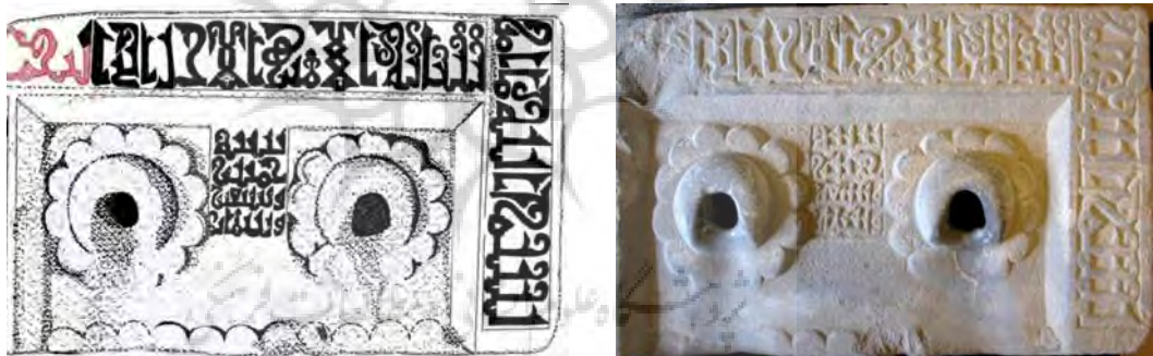
تصویر ۲. کتیبه آب‌انبار حسنویه، ۳۷۵ ه.ق، عکس و اجرا از احمد پرویز. منبع: پرویز، ۱۳۹۹.

۲. کتیبه‌های سنگی آب‌انبار حسنویه: دومین کتیبه مورد مطالعه در پژوهش حاضر مربوط می‌شود به آب‌انباری به سال ۳۷۵ ه.ق در ویرانه‌های «شاپورخواست» که نزدیک خرم‌آباد یافت شده است (تصویر ۲). این لوحه‌ای سنگی با دو کتیبه ۵ نقر شده به کوفی مورق ۶ ؛ الف. نوار پیرامون قاب و ب. درون قاب. نوع کتیبه احداثیه است. «این کتیبه همانند کتیبه قبلی از متن نمی‌توان به ماهیت بنایی که ساخته‌اند پی برد؛ محتمل است آب‌انباری بوده باشد؛ چرا که به گفته رودراوری بدر بن حسنویه مال بسیار خرج ساختن آب‌انبارها کرده بود» (بلر، ۱۳۹۴، ص. ۸۲). این کتیبه نواری پیرامونی دارد و نقش‌هایی گیاهی پرکاری زمینه قاب اصلی را پر کرده است. به برگ‌های دو پر اکتفا نکرده‌اند و بر دندان‌های (ب) و (س) در بسم برگ‌های سه پر نهاده‌اند. «کتیبه نوشتاری زیبا و ظریف دارد. اگرچه در مضمون از کتیبه پل کلهر پیروی می‌کند، اما پرداخته‌تر از آن است. نواری پیرامون دارد و نقش دو گل لوتوس پرکار به شکل برجسته و قبه مانند، زمینه قاب اصلی را پر کرده‌اند» (پرویز، ۱۳۹۹).