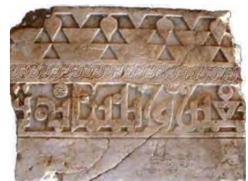
تصویر ۵. کتیبه‌های سرماج. منبع: چهری، م و چهری، ر، ۱۳۹۶، ص. ۱۸۳۹.