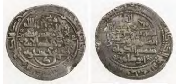
تصویر ۷. نام شمس‌الدوله بر روی سکه دوره بدر بن حسنویه، ۴۰۲ ه.ق.