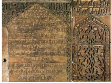
تصویر ۸. الواح چوبی عضدالدوله ۳۶۳ ه.ق.