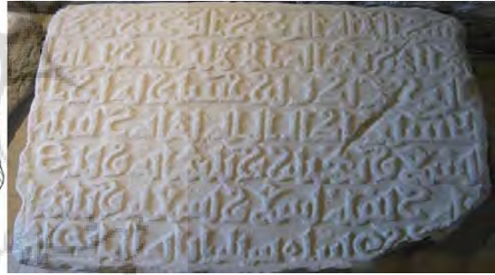
تصویر ۳. کتیبه پل کشکان، ۳۹۹ ه.ق، عکس و اجرا از احمد پرویز. منبع: پرویز، ۱۳۹۹.

کتیبه پل کشکان همانند دو کتیبه پل کلهر (تصویر ۱) و پل حسنویه (تصویر ۶) در چند سطر نگارش شده است. فاصله بین سطور به‌اندازه‌ای است که امتداد و کشیدگی حروف عمودی سبب تداخل سطرها نشده است. حروف یکسان در حالت کلی شبیه به هم نگارش شده‌اند، اما در فرم به‌صورت دقیق منطبق با یکدیگر نیستند. به‌عنوان مثال، فرم دندانها. با تمام این توصیفات روحیه کلی کتیبه، منسجم و عناصر دارای وحدت در فرم و شکل هستند. رشد و حرکت فرم دو پر در بین حروف و سطور سبب شده تمام سطح کتیبه با نقوش و کلمات پر شوند. همراهی نقوش و حروف در همراهی فضاهای منفی کتیبه، ترکیبی سیال و روان ایجاد کرده است. وزن ۱۰ حروف نسبت به کتیبه پل حسنویه که مشابهت بیشتری با این کتیبه دارد، زیاد نیست. نبود اصول نگارشی برای فرم حروف، سبب کاهش خوانایی شده است. مانند تنوع ارتفاع دندانها که قانون ثابتی برای نسبت دندانها به یکدیگر و نسبت به سایر حروف وجود ندارد.