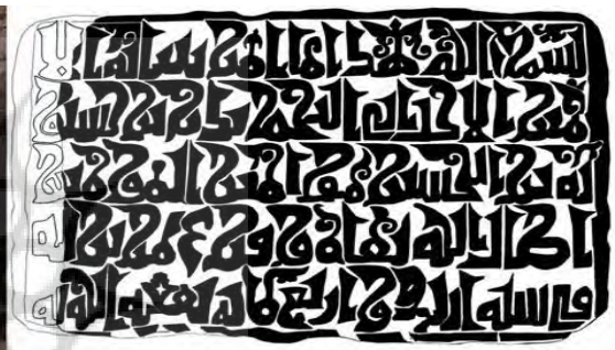
تصویر ۶. کتیبه پل حسنویه، ۴۰۴ ه.ق، عکس و اجرا از احمد پرویز. منبع: پرویز، ۱۳۹۹.

در ضخامت فرم‌های نوشتاری متن این کتیبه از الگوی ثابتی پیروی نمی‌شود. فرم حروف نسبت به کتیبه پل کشکان (تصویر ۳) ضخیم‌تر است، سبب شده فضای کتیبه تیره‌تر و متراکم‌تر به نظر بیاید. فرم کلی نوشتار با سایر کتیبه‌های این دوره، مشابهت دارد و همچنین ترکیب کلی کتیبه به‌ظاهر هماهنگ به نظر می‌رسد، اما کیفیت نوشتار در تمام سطح کتیبه یکسان نیست، اتصالات حروف در بخش‌های پایانی متن ضعیف، ناهماهنگ با سایر بخش‌های کتیبه است. عدم تشابه فرم در حروف یکسان کاملاً مشخص است و به اصول اولیه نگارش در آن‌ها توجه نشده است؛ مثال، فرم حرف (ن) با امتداد رو به بالا به‌صورت گردن‌قویی است، اما هیچکدام از فرم‌های این حرف در این کتیبه کاملاً شبیه هم نیستند. حروف (و)، (م) که با فرم گردن‌قویی ترکیب شده‌اند نیز مشابه یکدیگر نگارش نشده‌اند (جدول ۲). در کتیبه‌های خط کوفی گاهی هنرمند برای به‌دست آوردن ترکیب زیبا، ممکن است از یک حرف چندین فرم مختلف استفاده کرده باشد، اما در این کتیبه، یک حرف با یک فرم مشخص، یکسان نگارش نشده است. کتیبه پل حسنویه نسبت به سایر کتیبه‌ها، مشابهت بیشتری به کتیبه پل کشکان دارد.