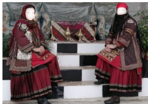
تصویر ۲. سرپوش بانوی یکجانشین. مأخذ: آلبوم خانوادگی خانم رضاییان (دهه ۹۰). مأخذ: آرشیو نگارندگان.