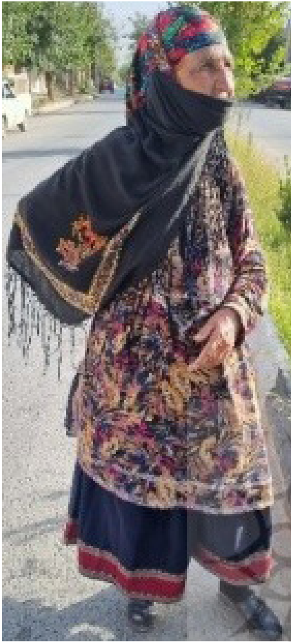
تصویر ۸. پاچه بانوی یکجانشین صوفیانلو (لایین).

قرمز است و رنگ‌های دیگر با آن همراه می‌شوند تا زیباترش کنند. این قطعه در میان کوچ‌نشینان از نظر کاربرد اهمیت دارد و آن را به هنگام فعالیت به کمر می‌بندد (تصویر ۱۱)، بنابراین رنگ‌هایی خاموش‌تر در آن به کار رفته است؛ ولی در میان یکجانشینان جذابیت و زیبایی آن وجود می‌یابد زیرا در هنگام ازدواج بر سر عروس می‌اندازند (تصویر ۱۲)، به همین دلیل از رنگ‌های شادی‌بخش مانند زرد در آن استفاده می‌شود تا هرچه تمام‌تر بدرخشد و پرشکوه جلوه‌گر شود. رنگ‌های زنده مانند زردهایی که انسان با دیدنش شاد می‌شود و سرخ‌هایی که نمادی از انرژی‌اند، کنار سیاه قدر، در حال تبدیل شدن و نوشدن در تکرار پی‌درپی هستند. جنس آن از ابریشم دستبافت است و رنگ‌ها با عبور از میان یکدیگر تبدیل به مربع‌ها می‌شوند که نمادی از مادیت دارند. با ترکیب خطوط عمودی (تار) مستحکم و خطوط آرام افقی (پود) چهارگوشه‌ای جدید ابداع می‌شود؛ چهارخانه‌هایی که از درون یکدیگر عبور کرده‌اند، گویی تارو پود دست در دست یکدیگر داده‌اند تا سطحی از رنگ‌های جذاب و لذت‌بخش را به غایتی برآورده