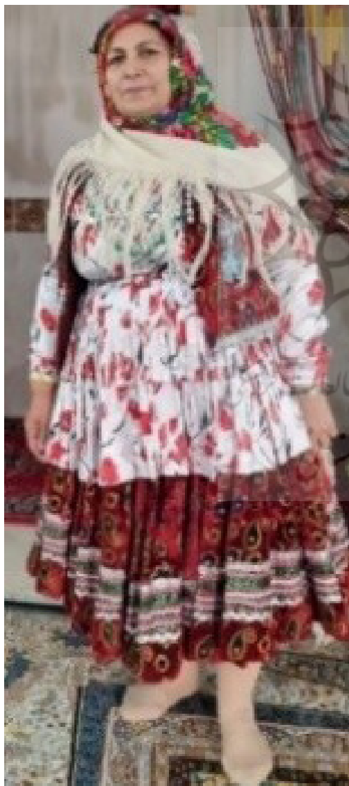
تصویر ۷. شلیته (شیلوار) بانوی بریمانلو.

یادآور نگاه وحدت در کثرت و کثرت در وحدت و به گونه‌ای معرف یگانگی خداوند است؛ بشر همچون دیگر موجودات، در جستجوی وحدت بوده و بافنده مانند پیشینیان خویش، نگاهی رو به بالا دارد و در پی یگانگی است؛ این چرخش رنگ که باعث به وجود آمدن نقوش در این دستبافته شده است، هنریست که ریشه در تجربه و معرفت بافنده دارد که از طبیعت یافته و توانسته است بافته خویش را به کمال بارور سازد و پویایی را در آن به نمایش بگذارد. پیراهن یکجانشینان پارچه‌ای کاملاً دستباف دارد با رنگی سرخ که نوشته‌اند قرمز پرهیجان است و انرژی مضاعف دارد (آیزمن، ۱۳۹۲، ۲۳)، هنوز با همان کیفیت، جلال و جمال گذشته توسط هنرمند بافنده بافته می‌شود. نقوش در تاروپود پارچه، همچون پیله ابریشم در هم تنیده و از لبه پایین پیراهن تا قسمت شانه‌های پوشنده را فرا می‌گیرد و نقشی بر نقوش جهان هستی می‌افزاید. چنانکه در فرهنگ قدیم چین و ژاپن معتقد بوده‌اند که هنرمند، با کشیدن تصویر گل و گیاه از طبیعت تقلید نمی‌کند، بلکه بر گل و گیاهان واقعی طبیعت می‌افزاید (کشاورز و جوادی، ۱۳۹۸، ۱۱).