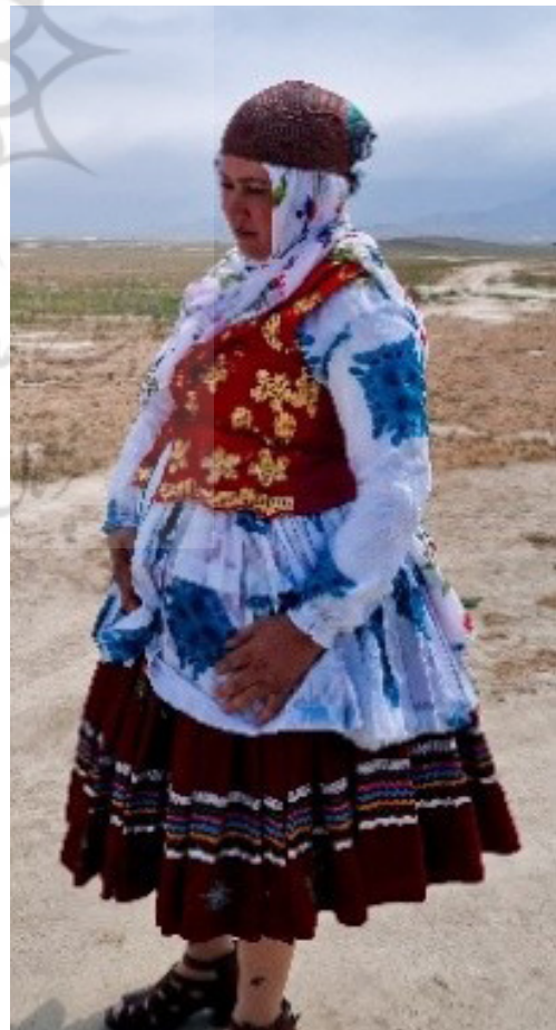
تصویر ۹. جلیقه بانوی کوچ‌نشین قره‌مانلو.