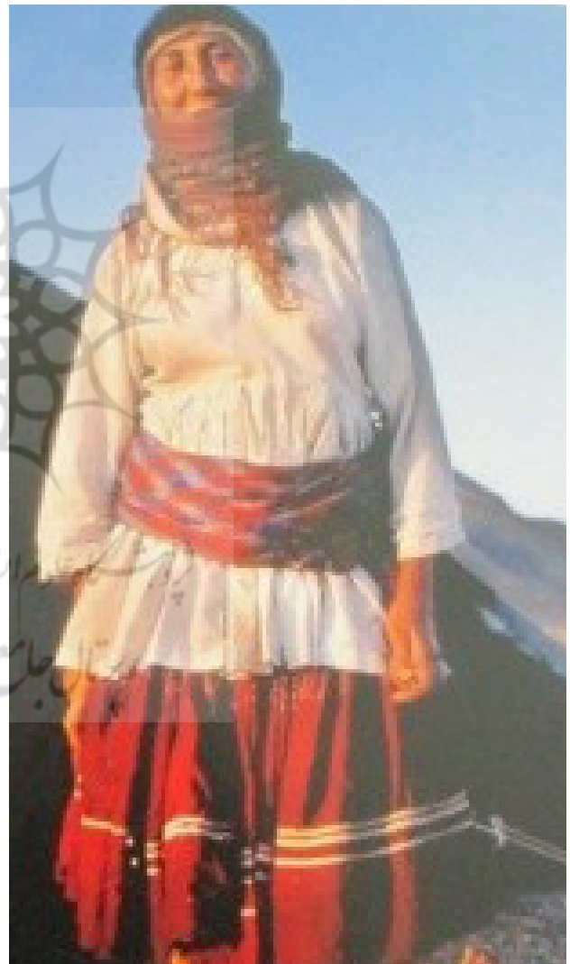
تصویر ۱۱. بستن چادر به کمر بانوی کوچ‌نشین.

نتیجه‌گیری بررسی پوشاک بانوان کرد شمال خراسان نشان داد کردهای