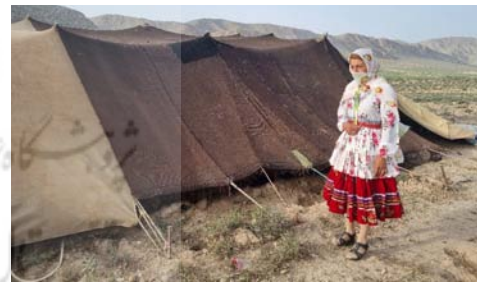
تصویر ۱. سرپوش بانوی کوچ‌نشین قره‌مانلو.