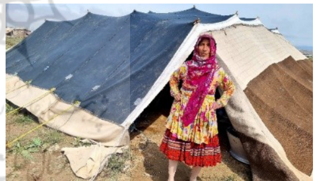
تصویر ۵. بانوی کوچ‌نشین با پوشش گراس.