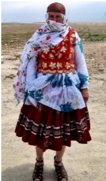
تصویر ۳. سرپند بانوی کوچ‌نشین قره‌مانلو.