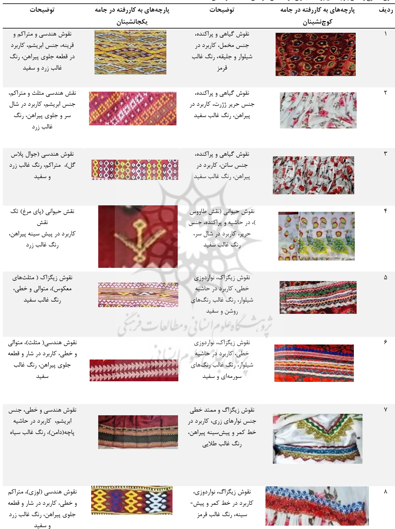
جدول ۱. طرح و نقش پارچه‌های پوشاک بانوان گُرد شمال خراسان.