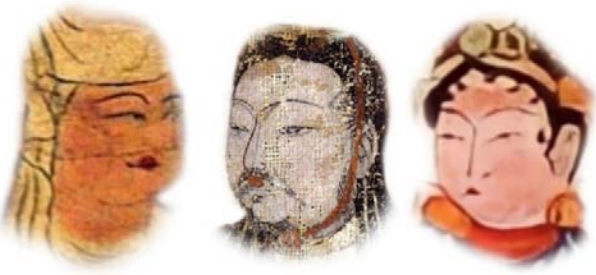
تصویر ۳. نمونه‌هایی از چهره‌نگاری مانوی که به چهرهٔ چینی‌ها شبیه هستند.