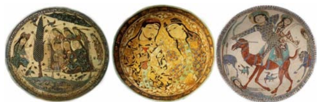
تصویر ۱۸. نمونه‌هایی از سفالینه‌های دوره سلجوقی.