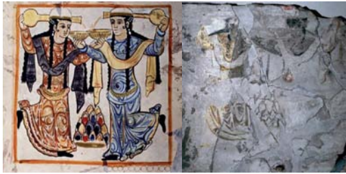
تصویر ۱۰. دیوارنگاره اصلی و تصویر بازسازی شده از دو رقص درباری، کاخ جوسق الخاقانی سامرا.