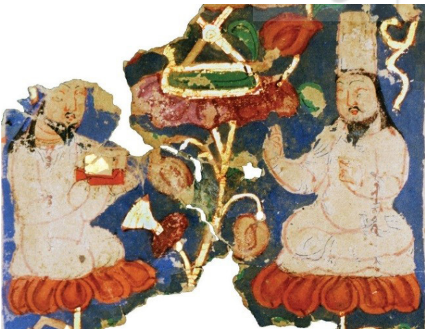
تصویر ۱. قسمتی از یک نگاره مانوی بر روی کاغذ.

با توجه به این‌که هنر مانوی در خدمت دین مانوی بود و نگاره‌ها براساس آموزه‌های این دین طراحی و تصویرسازی می‌شدند و رسالت این دین نیز رسیدن روح انسان به رستگاری و بهشت نور بوده؛ بنابراین فرم‌های انسانی از اجزا و عناصر اصلی و جدانشدنی نقاشی مانوی است. با بررسی آثار باقی‌مانده از نقاشی مانویان و مشاهده فرم‌های انسانی و مقایسه چهره‌ها