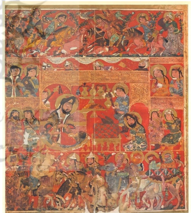
تصویر ۲۰. تصویری از رسالۀ جالینوس، سلطان و ملازمان او و سایر وقایع.

است، گویا در هر کادر اتفاقی در حال وقوع است. این نگاره حاوی تعداد زیادی پیکره انسانی است که هر کدام (به‌صورت دوتایی و یا گروهی) در قسمتی از کادر قرار گرفته‌اند. چهره‌ها همه به‌صورت یکسان ترسیم شده‌اند، صورت بیضی و سهرخ، چشمان بادامی و کشیده و ابروان بلند، دهان کوچک، بینی