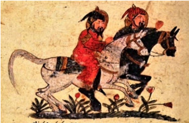
تصویر ۱۴. کتاب البیطره، دو سوارکار، بغداد.