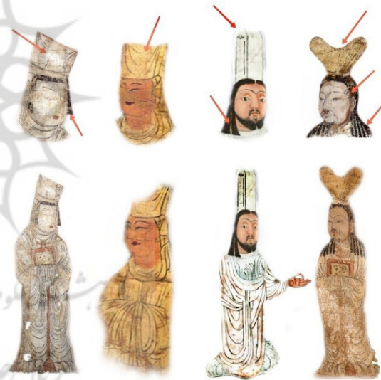
تصویر ۷. نمونه‌هایی از نوع پوشش و آرایش موهای زن و مرد برگزیده.

توالی اسفبار اعمال تخریبی است که نمونه‌های موجود هنر تصویری را دچار تطاول کرده است. نقاشان ایران دیوار قصرها را تزئین می‌کردند، اما این آثار هنری با تختگاه‌های شاهان از بین می‌رفتند و فقط چند قطعه از این دیوارنگاره‌ها به طور پراکنده باقی می‌ماند. ماده دیگری که نقاشان با آن سروکار داشتند، کاغذ بود؛ کاربرد مداوم این ماده ظریف در غرب بسیار بی‌ثبات و نامطمئن بود و این بی‌ثباتی در شرق دوچندان می‌شد؛ اما جریان نابه‌سامان تاریخ جهان اسلام بدتر از هر تخریب دیگر، آثار هنری را دچار تطاول و خسران کرد. آتش‌سوزی کتابخانه‌ها در بخشی از جهان سانحه جبران‌ناپذیری بود و بی‌تردید در آتش‌سوزی سال ۹۹۸/۳۸۹ که کتابخانه سلطان سامانی را با خاک یکسان کرد و گفته شده که حاوی گنجینه‌های بی‌نظیری بود، بسیاری از آثار هنری ایران دستخوش آتش شده است (آرنولد و پوپ، ۱۳۹۳، ۳-۵)؛ بنابراین اطلاعات ما از چگونگی هنر تصویری ایران در سده‌های نخستین اسلامی به چند نقاشی دیواری آسیب‌دیده، تصویر روی ظروف سفالی و فلزی و نیز گزارش‌های بعضی از مورخان مسلمان در این باره محدود می‌شود (پاکباز، ۱۴۰۰، ۴۶-۴۷).