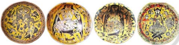
تصویر ۱۵. نمونه‌هایی از سفالینه‌های نیشابور دوره سامانی.

بیضی و با زاویه سه‌رخ، سر خم شده به سمت شانه، چشمانی ریز و کشیده، ابروان نازک، بینی به شکل خطی صاف و بلند، دهان کوچک و لب‌های غنچه و هاله دور سر اشاره کرد (تصاویر ۱۶ و ۱۷). موها نیز به صورت ریخته شده در پشت سر و در قسمت بناگوش نیز یک حلقه موی تقریباً بلند و پیچان آویزان است. از لحاظ پوشش آن چه از دیوارنگاره‌های به‌جامانده پیداست پیکره‌ها پیراهنی منقش و بلند با بازوبند و کمر بند بر تن دارند (تصویر ۱۶).