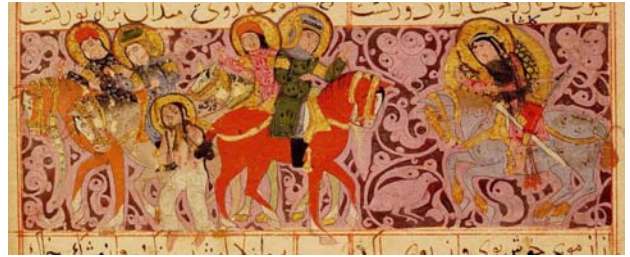
تصویر ۲۱. تصویری از کتاب ورقه و گلشاه، اسیر شدن ورقه و رخ نمودن گلشاه در برابر ربیع.