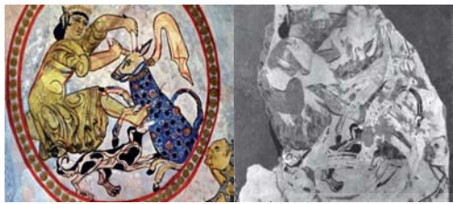
تصویر ۱۱. دیوارنگاره اصلی و تصویر بازسازی شده از زن شکارچی، سامرا.

جملگی این تأثیرات در یک کلیت اسلامی درهم تنیده شده است (آژند، ۱۳۹۹، ۹۷-۹۸). نقاشی‌های دوره متقدم و میانی عصر عباسی بیش‌تر در نقاشی‌های دیواری جلوه یافته و هنر تصویری دوره پایانی یعنی دهه‌های پسین قبل از فروپاشی خلافت و پایتخت آن بغداد به صورت نگارگری خطی به دست آمده است (کونل، ۱۳۸۸، ۸۸-۸۷). از کتاب‌های مکتب بغداد می‌توان کلیله و دمنه، مقامات حریری، الاغانی، الادویه المفردة یا الحشائش، صورالکواکب، البیطره و دیگر نسخ علمی و ادبی مصورسازی را نام برد، این نسخ از نظر به کاربردن موضوعات، قدرت نقاشی و رنگ‌آمیزی موفق بوده‌اند (همان). نسخه الاغانی نوشته «ابوالفرج اصفهانی» که در سال‌های (۶۱۴-۶۱۶ ه.ق) کتابت شده، مربوط به مکتب بغداد است (کاتلی و هامبی، ۱۳۷۶، ۳۵). در نگاره‌های این کتاب تصاویری از فرمانروایان همراه با کنیزکان و رقصندگان و خنیاگران نقش‌بسته و سفره‌ها آکنده از خوردنی‌ها و نوشیدنی‌ها است (آژند، ۱۳۹۹، ۹۹-۱۰۰). در یکی از تصاویر این کتاب (تصویر ۱۲)، پادشاهی در مرکز و بانوانی (ملازمانش) در اطراف او تصویر شده‌اند. صورت پادشاه تمام‌رخ و گوشت‌آلود، چشمانی ریز و بسیار کشیده، ابروانی با خمیدگی ملایم، نازک و بلند، دهان کوچک و لب‌ها غنچه‌ای، ریش و سبیل حجیم و سیاه، دورگیری صورت، بینی، خط پشت پلک و دست‌ها به رنگ قرمز، موهای پادشاه نیز پنهان در کلاه و هاله‌ای منقوش دور سر دارد. جامه‌اش بلند با نقش و نگار و بازوبندی بر دستانش بسته شده است. ملازمان نیز مشخصات چهره‌شان همانند پادشاه می‌باشد و تنها صورت آن‌ها زاویه سهرخ دارد و هاله