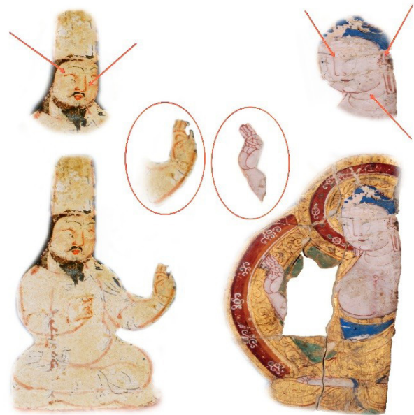
تصویر ۵. چهره‌پردازی‌های مانوی با دورگیری به رنگ قرمز و ژست دست ایزد و برگزیده به شکل وینارکا مودرا.

از سده نخستین اسلامی اطلاعات پراکنده‌ای درباره تحولات هنر تصویرگری ایران وجود دارد این اطلاعات را می‌توان گاهی از لابه‌لای متون تاریخی، ادبی و گاهی از بازمانده‌های هنری دوران اموی و عباسی به دست آورد. ایرانیان در روی کارآمدن عباسیان نقش زیادی داشتند و تأثیرات فرهنگی و هنری آن‌ها در آثار هنری خلافت عباسی کاملاً پیداست. این تأثیرات را می‌توان در بازیافته‌های سامرا و کاخ‌های عباسیان دید که از نقش‌مایه‌های تأثیرات ساسانی و مواریت آسیای میانه بهره‌یاب شده است (اژند، ۱۳۹۹، ۱۰۵). کهن‌ترین نقاشی‌های دوره اسلامی، فوق‌العاده کمیاب هستند، دلایل و علل فقدان اطلاعات متعدد است، پیش از همه تحریم و خصومتی بود که در جهان اسلام نسبت به بازنمایی پیکره انسانی و در واقع کل اشکال حیات حیوانی ابراز می‌شد. دومین عاملی که منجر به چنین حوزه تنگ پژوهش شد،