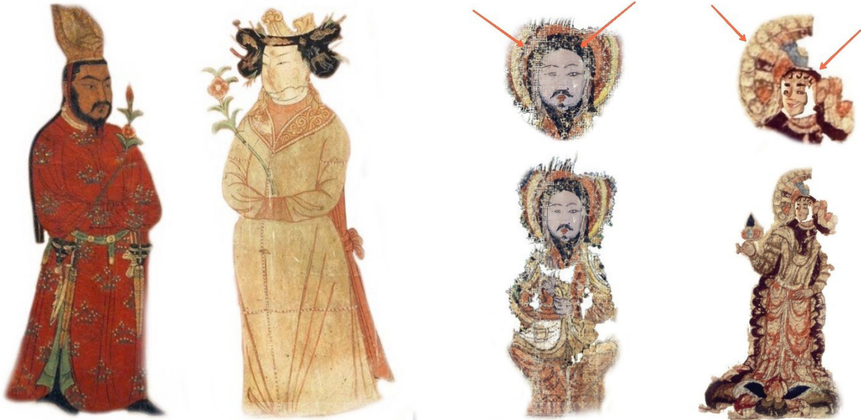
تصویر ۶. نمونه‌های از نوع پوشش، آرایش مو و هاله دور سر ایزد مرد و زن مانوی.