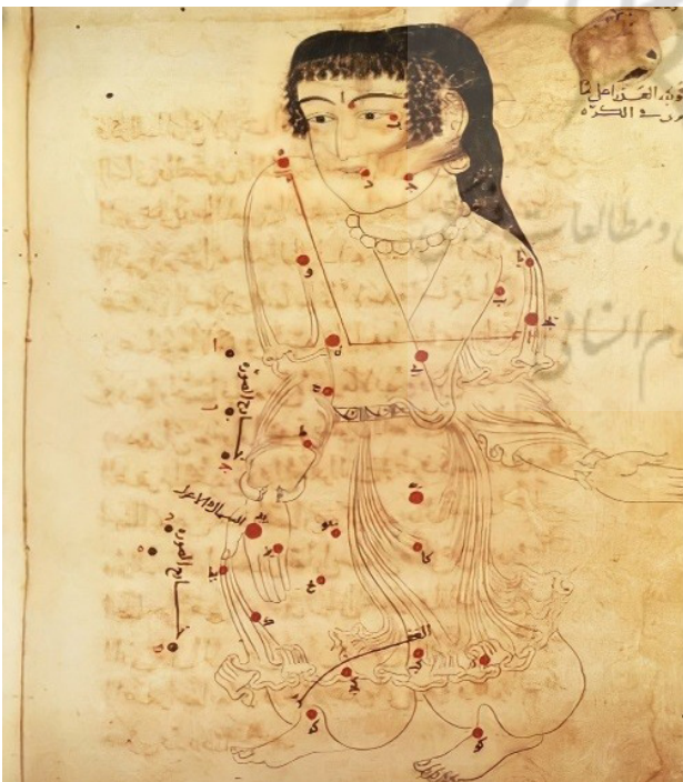
تصویر ۱۳. کتاب صورالکواکب الثابتة صوفی.

ساده و تک‌رنگ دور سر دارند. موهای بانوان نیز به صورت دو طره موی بافته شده اطراف صورت است.