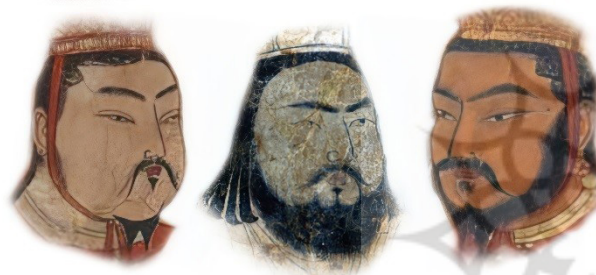
تصویر ۴. نمونه‌هایی از چهره‌نگاری مانوی که به چهرهٔ اویغورها شبیه هستند.

به رنگ مشکی اجرا شده است. در نگاره‌های مانوی معمولاً ژست دست و انگشتان ایزدان و یا برخی برگزیدگان ۴ مرد در حالت موعظه به حالت ویتارکا ۵ اجرا شده و در حین ژست گرفتن بازو خمیده به پهلو و یا جلوی بدن نگه داشته شده است (تصویر ۵)؛ اما به صورت کلی گزیدگان (زن و مرد) و هم‌چنین نیوشایان دست‌هایشان پنهان شده در آستین و به حالت احترام بوده است.