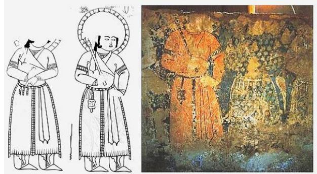
تصویر ۱۶. بخشی از دیوارنگاره کاخ لشکری بازار، سده پنجم ه.ق.

یک نسخه دیگر هم که تاکنون به مکتب بغداد منسوب بوده یعنی رساله جالینوس موجود در کتابخانه دولتی وین، دارای تعدادی از نگاره‌ها با یک پس‌زمینه قرمز و جزئیاتی از تزئین تصاویر است که سبک سفال‌های مینایی را در ذهن می‌گنجاند (آرنولد و پوپ، ۱۳۹۳، ۴۰). یکی از نگاره‌های این کتاب (تصویر ۲۰) به صورت تقسیم‌بندی و کادربندی شده