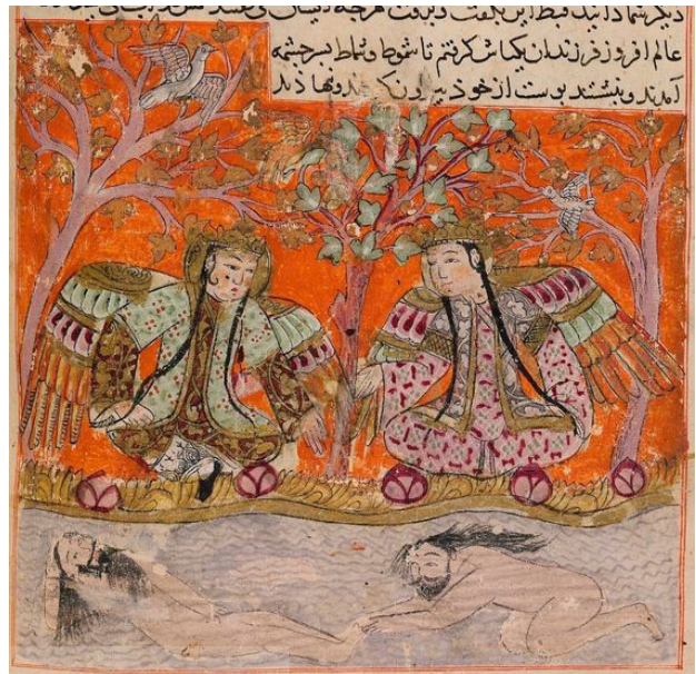
تصویر ۱۹. تصویری از کتاب سمک عیار، شمس به حرف‌های شمات و پریان گوش می‌دهد. مأخذ: آرنولد و پوپ، ۱۳۹۳، ۳۴۸.

چنان‌چه ذکر شد مانویان در چهره‌پردازی‌های خود از چهره‌های مردم چین و ترکان آسیای میانه (اویغورها) وام گرفتند و سپس با استفاده از ذهن خلاق خود و با روشی متفاوت چهره‌های مخصوص به خود را در نگاره‌هایشان خلق کرده‌اند. در نقاشی‌های دوره‌های بعدی نیز شیوۀ چهره‌نگاری مانوی مشاهده می‌شود. در سده‌های ابتدایی دوره عباسی که بیش‌تر دیوارنگاره رایج بوده الگوهای چهره‌نگاری مانوی کم‌تر دیده می‌شود؛ برخی جزئیات مانند کشیدگی انتهای چشم‌ها و ترسیم بینی به شکل خطی و صورت با زاویۀ سهرخ و رنگ‌گذاری‌های تخت و بدون سایه‌گذاری در دوره عباسی نیز اتفاق افتاده است و هم‌چنین مهم‌ترین مشخصه چهره‌نگاری مانوی که ترسیم چهره‌های یکسان بوده در دیوارنگاره‌های عباسی نیز تکرار شده است. در نگاره‌های کتب مکتب بغداد نه‌تنها از اصول چهره‌نگاری مانوی استفاده شده بلکه چهره‌ها قرابت بسیار نزدیکی به چهره‌های موجود در نگاره‌های مانوی دارند، خصوصاً در کتاب الاغانی (تصویر ۱۲)؛ حتی از روش دورگیری صورت به رنگ قرمز که روش مخصوص