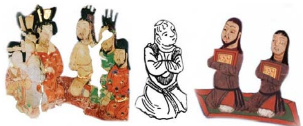
تصویر ۸. سمت راست نیوشندگان از طبقه عادی، قسمت میانی نیوشایی جوان و سمت چپ نیوشندگان از طبقه سلطنتی.

با روی کار آمدن عباسیان که پایتخت خود را از دمشق به بغداد انتقال دادند، این شهر مرکز فرهنگی جهان شد و با توجه به این‌که بغداد در نزدیکی تیسفون یکی از بزرگ‌ترین پایتخت‌های جهان باستان و ایران بود می‌توان دیدگاه‌های زیبایی‌شناسانه و هنری ایران را حتی قرن‌ها پس از سقوط