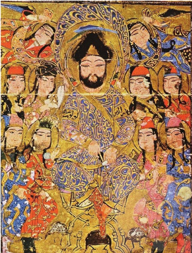
تصویر ۱۲. پادشاه و ملازمان او، کتاب الاغانی، احتمالاً موصل. مأخذ: آژند، ۱۳۹۹، ۱۰۰.