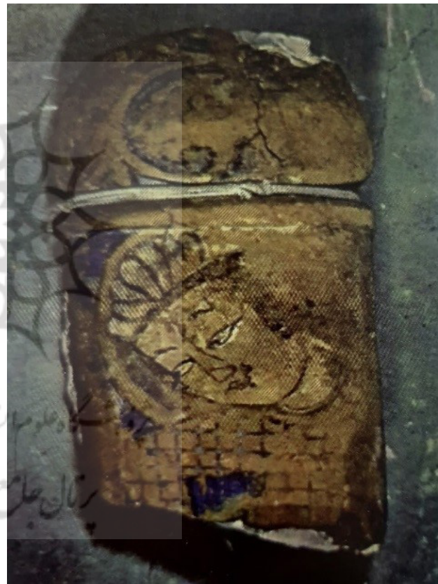
تصویر ۱۷. چهره شخصی بر روی یکی از ستون‌های کاخ لشکری بازار، غزنویان.