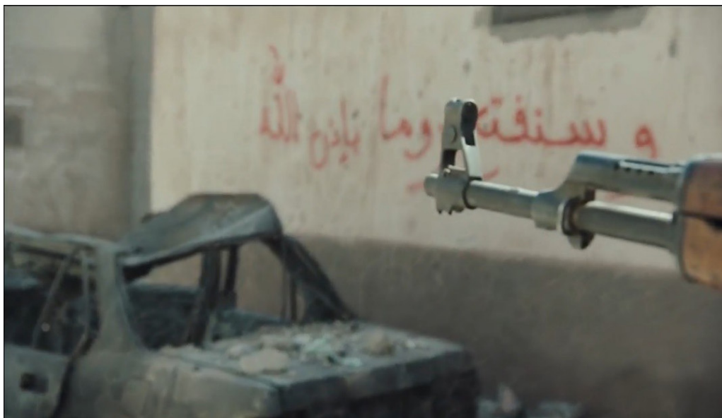
تصویر ۲. شعرنویسی بر دیوار به مثابه بیان دیدگاه در مقابل اسلحه به مثابه نماد زور، سکansı از فیلم موصل.