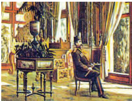
تصویر ۱ الف. بخشی از تصویر ۱.

پس زمینه بیرون از تالار به منزله کنش و فرم‌های برآمده از تحولات فرهنگی - اجتماعی است که در فرهنگ و هنر سپهرنشانه‌های قاجار ظهور می‌یابد. مجاورت نور و پنجره با آینه مواجهه خود با خود با توانشی مضاعف است بنابراین مواجهه بدن ناصرالدین شاه با بدن دیگری نیز در قالب این توانش جای گرفته و آینه‌وارگی از بدن می‌آفریند یعنی تکرار و انعکاس مضاعف معانی حاصل شده از تقابل نظم و خود با آشوب و دیگری.