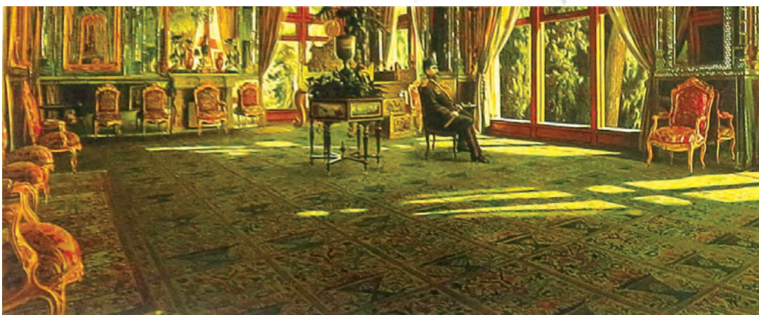
تصویر ۱ ب. بخشی از تصویر ۱، کمال الملک، تالار آینه، رنگ‌روغن روی بوم، ۱۲۷۴ ه.ش/ ۱۸۹۵ م

امیر نصری به نقل از جیمز ال‌کینز در کتاب تصاویر بدن اشاره می‌کند که: «ما بدن‌ها را حتی در جایی که نیستند، ملاحظه می‌کنیم، و خلق یک فرم تا حدی خلق یک بدن است.» (نصری، ۱۳۹۴، ۲۹۹). بر مبنای گفته ال‌کینز، تسلسل صندلی‌ها در حاشیه سمت چپ و تخت طاووس ۱ که در گوشه و انتهای تالار مستقر شده است، خالق بدن‌هایی هستند که با جایگاه بدن ناصرالدین شاه مناظره‌ای برقرار می‌سازند. صندلی یکی از عناصر بسیار مهمی است که زاینده بارز آشوب و «نه - فرهنگ» است بنابراین تمام صندلی‌ها به مثابه «بدن - آشوب» تلقی می‌شوند. تخت طاووس دلالت ضمنی بر سنت و پادشاهی فتحعلی‌شاه دارد پس خالق جایگاه بدن در غیاب فتحعلی‌شاه است. همان‌طور که سیامک دل‌زننده می‌نویسد: «حضور خاموش و حاشیه‌ای تخت طاووس