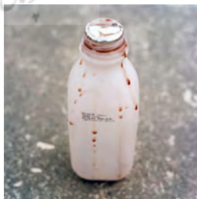
تصاویر ۶ و ۷- مهران مهاجر (۱۳۸۵)، توپ و تاریخ گذشته (آرشیو شخصی نگارنده).