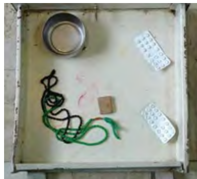
تصاویر ۹ و ۱۰- میثم محفوظ، کشو، ۱۳۸۸.