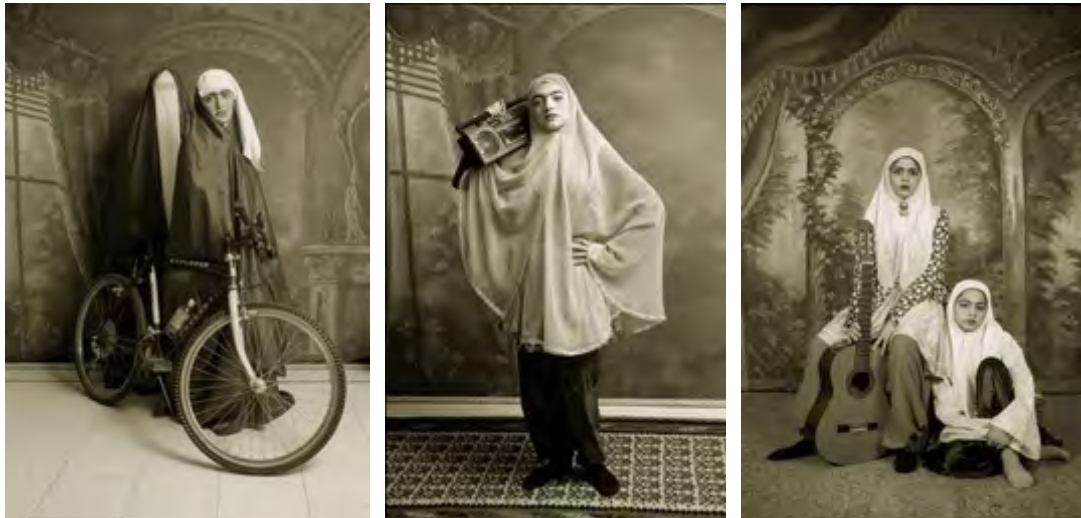
تصاویر ۱، ۲ و ۳، شادی قدیریان، قاجار، ۱۳۷۸.

پیچیده تر شده اند. با متنوع تر شدن اشیا، فیگورهای ماکم و کم تر می شوند. امروزه هدف اشیا آن ها را به بازیگران یک فرایند جهانی تبدیل ساخته است که انسان فقط در آن نقش بازی می کند یا تماشاگر است (بودریار، ۱۳۹۵: ۲۳).