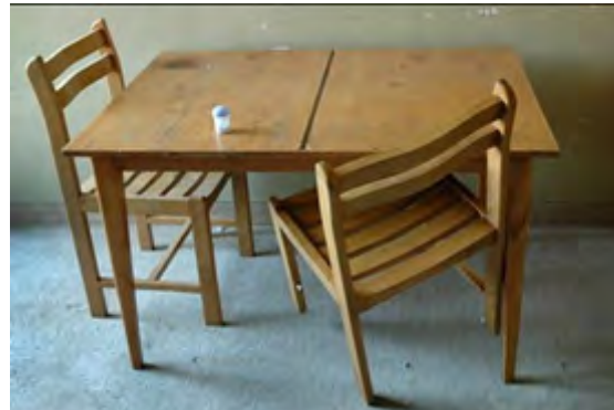
تصاویر ۱۱ و ۱۲- بهنام صدیقی، ۱۳۸۴، حال همه ما خوب است (URL1).

جدول ۱. بررسی نمونه‌های انتخابی در پژوهش به روش تحلیل متن پل جی: فعالیت‌های متن (Gee, 2011:715).