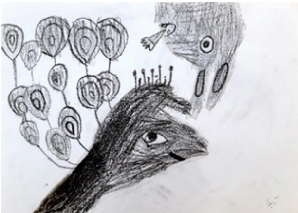
تصویر ۶. تبدیل سایه دست به موجود جاندار، اثر کودک ۸ ساله در تمرین نور و سایه.