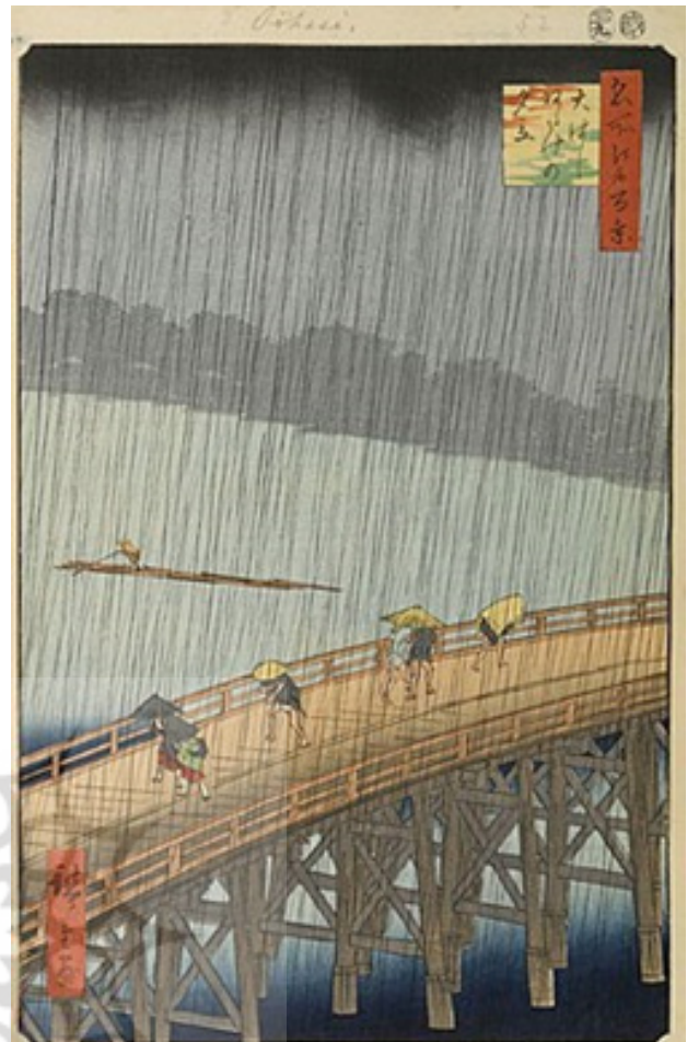
تصویر ۴. رگبار ناگهانی روی پل آهالی نزدیک آتاکاه اثر آندو هیروشیگه (۱۸۵۷).

آزمایش که رده سنی ۷ تا ۹ سال قرار داشتند با توجه به رده سنی باید در مرحله یک یا دو قرار داشته و در پس آزمون نیز همین مورد تکرار شود در صورتی که تأثیر آموزش هنر که در تحلیل فوق از نظریه تحول رشدی زیبایی شناسی پارسونز نیز مطرح شد، سبب شد قابلیت های ادراکی ارتقاء یابد. در پژوهش کنون (Cannon, 2005) نیز تأثیر برنامه های آموزشی هنر با محوریت عکاسی این قابلیت را در کودکان افزایش داد که همراستا با پژوهش حاضر بوده و مبین نقش تأثیر برنامه های آموزش هنر در ارتقای درک هنری و رشد سطح تفکر زیبایی شناسی کودکان است.