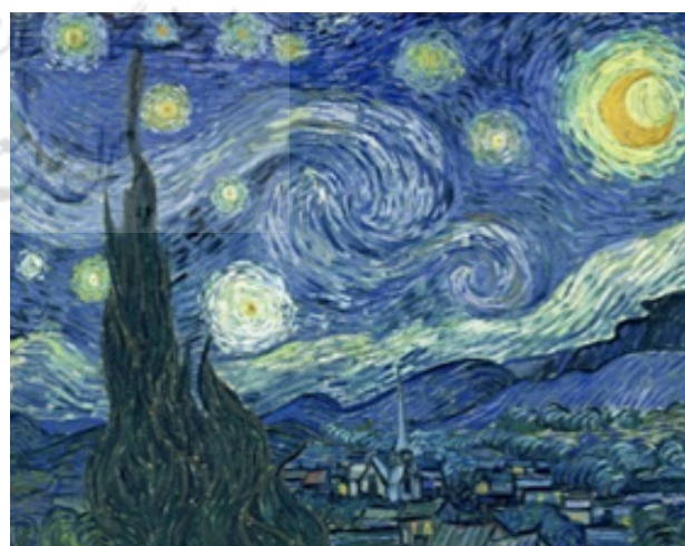
تصویر ۳. شب پرستاره اثر ونسان ون گوگ (۱۸۸۹). مأخذ: https://nl.wikipedia.org/wiki .

و رگبار ناگهانی روی پل آهاسی نزدیک آتاکاه اثر آندو هیروشیگه ۲۵ (۱۸۵۷) (تصویر ۴) و بحث و گفت‌وگو در این