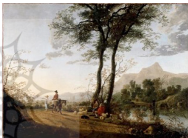
تصویر ۲. جاده‌ای نزدیک رودخانه اثر آلبرت کوئیپ (۱۶۶۰).