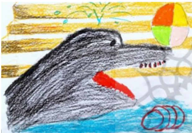
تصویر ۷. تبدیل سایه دست به موجود جاندار، اثر کودک ۹ ساله در تمرین نور و سایه.