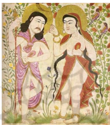
تصویر ۴. آدم و حوا، لحظه وسوسه، ابن بختیشوع (۶۹۵ ه.ق.)، نگارگر ایرانی، نگارگری مکتب تبریز اول، دوره ایلخانی

در این اثر نقاش با کشیدن چندین خوشه گندم در دستان حوا، مانند آثار هنری غربی، او را عامل وسوسه آدم می‌داند. در واقع در برخی منابع اسلامی، میوه ممنوعه به جای سیب، گندم است و این گندم را حوا به آدم می‌دهد (صدوق، ۱۳۷۸: ۳۰۶). در گوشه سمت راست اثر، طاووس و مار نیز به تصویر کشیده شده‌اند. مطابق برخی منابع مانند روایت وهب بن منبه در تفسیر طبری، مار در انتقال پیام از ابلیس به حوا با او معاونت قابل توجهی داشته است و طاووس هم در درجه بعد در این هدف مؤثر بوده است (آخوندی، بی تا: ۳).