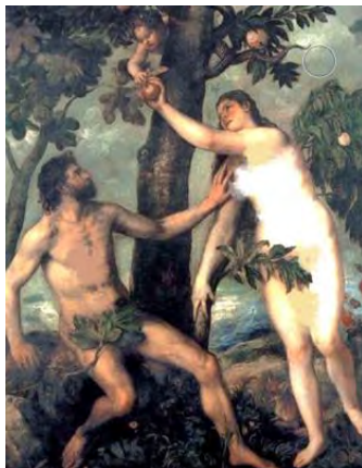
تصویر ۲. آدم و حوا اثر Tiziano Vecelli مشهور به Titien در سال ۱۵۵۰ م

نقاشی آدم و حوا در تصویر ۲، اثری از نقاش ایتالیایی تیتیان (۱۴۸۷-۱۵۷۶) است. در اثر فوق حوا در حال گرفتن میوه ممنوعه از دستان ابلیس است. ابلیس در این اثر به خلاف بسیاری از آثار مشابه در لحظه فریب آدم توسط حوا، به صورت مار یا موجودی شیطانی مصور نشده است. بلکه نقاش با به تصویر درآوردن شیطان به صورت کودکی معصوم، گویا قصد باورپذیر کردن امکان وسوسه حوا از ابلیس داشته است. از طرف دیگر آدم با بردن دست چپش به سمت کتف حوا سعی در منع او از فریب دارد. ممانعتی که در نهایت در فریب او از حوا بی تأثیر است. به هر جهت هرچند نقاش سعی در برانگیختن قضاوت منصفانه تر مخاطب نسبت به گناه نخستین داشته، در همین اثر نیز وسوسه آدم توسط حوا هویدا است.