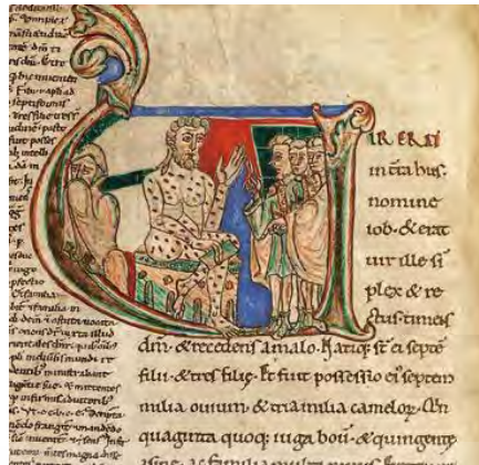
تصویر ۷. ایوب با همسر و دوستانش، قرن ۱۲ میلادی، بیبلیوتک ناسیونال دو فرانس، پاریس

در نگاره فوق از کتاب ایوب همراه با تفسیر (نسخه ۱۷۹۷۹، ورق ۷۳، به نقل از هارکینز و کنتی، ۲۰۱۶: ۳۰۷)، ایوب در مرکز نشسته است و رو به سوی دوستانش دارد که در سمت راست، با لباس‌های فاخری ایستاده‌اند و در حال شماتت او هستند. در سمت چپ همسر ایوب گرچه مانند دوستانش در مقام نکوهش ایوب تصویر نشده، ولی به شکلی معزول از این جمع نشسته و درحالی که لباسش را جلوی بینی خود گرفته تا بوی چرک و عفونت‌های بدن ایوب او را نیازارد، رو به سوی دیگری دارد (همان، ۳۰۹)، رفتاری که نشان‌دهنده کراهت شدید او از همراهی با ایوب را دارد.