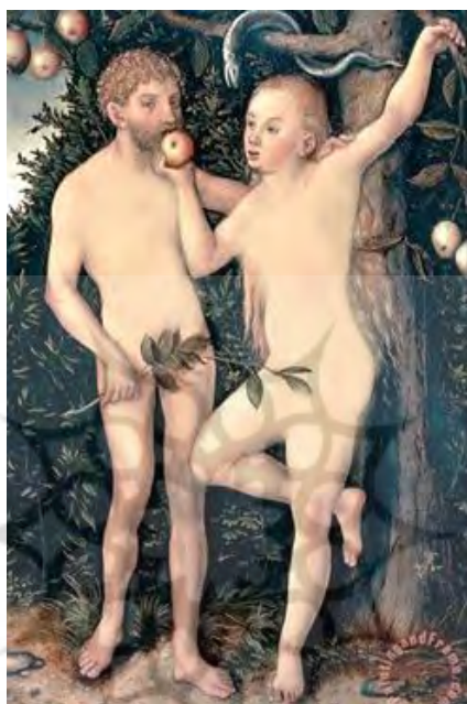
تصویر ۱. آدم و حوا، اثر Lucas Cranach در سال ۱۵۲۶ م

تابلوی نقاشی «آدم و حوا»، اثر لوکاس کراناخ (۱۴۷۲-۱۵۵۳ م.)، نقاش آلمانی است که بیشترین تعداد نقاشی از لحظه وسوسه آدم توسط حوا را در کارنامه هنری خود دارد. نقاشی حکایت از زمانی دارد که حوا با تعارف میوه ممنوعه به آدم قصد فریفتنش دارد. ماری که به شاخه‌های بالای درخت تنیده است، کنایه از وسوسه ابلیس است که به سمت حوا کج شده است. حلقه کردن دست آدم به دور گردن حوا، انسانی علاقه‌مند به همسرش را تداعی می‌کند که هیچ مقاومتی در مقابل درخواست همسر خود را ندارد. در مقابل حوا با تکیه دادن پای خود به درخت و لم دادن دست دیگرش بر روی شاخه درخت، مشابه روش نمایش سلطه‌گری و اعتماد به نفس در بسیاری از فرهنگ‌های مشابه در زبان بدن، امکان تسلط و سیطره خود بر آدم را به نمایش گذاشته است.