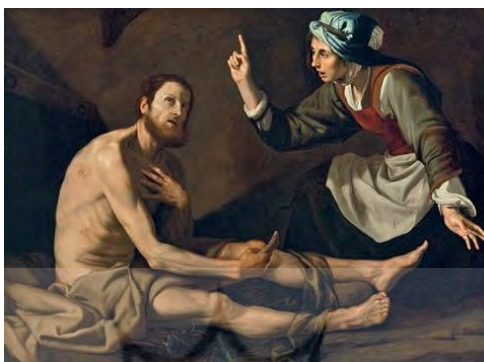
تصویر ۵. «ایوب توسط همسرش سرزنش می‌شود» با عنوان انگلیسی Job berated by his wife در سال ۱۶۳۲ م توسط Jusepe de Ribera

نقاشی بالا اثر جوزف د ریبرا، نقاش اسپانیایی (۱۵۹۱-۱۶۵۲) است. همان‌طور که در اثر مشخص است، نقاش برای القای فقر، بیماری و آزرده‌گی خاطر ایوب به مخاطب، او را به صورت نیمه‌برهنه درحالی که دنده‌هایش قابل‌شمارش است و پارچه‌ای مندرس روی پاهای خود قرار داده، بیماری و فقر ایوب را به تصویر کشیده است. درماندگی ایوب از جهت شماتت‌های همسرش با خیره‌شدن به آسمان، استعانت او از خداوند را تداعی می‌کند. این در حالی است که زوجه ایوب، برخلاف همسرش با لباس نسبتاً مناسب در حال سرزنش کردن او از جهت امتناع همسر برای طلب پایان سختی‌ها از خداوند است؛ چرا که انگشت اشاره را به سمت عرش الهی گرفته است.