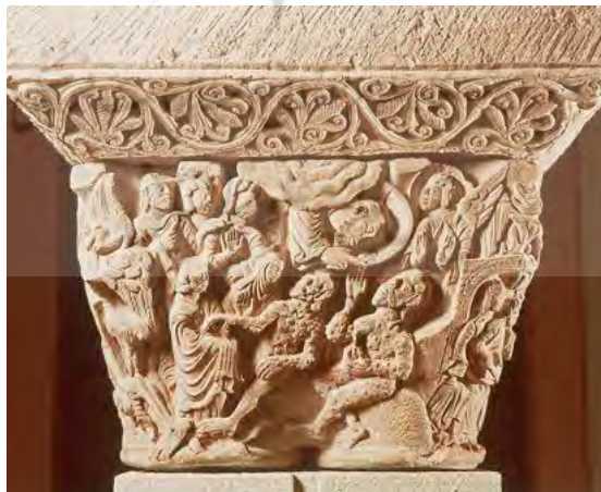
تصویر ۸. سرستون، سال ۱۱۴۵، هنرمند ناشناس، صومعه سابق کلیسای جامع، موزه ناوارا، پامپلونا، اسپانیا

در نگاره فوق از کتاب ایوب همراه با تفسیر (نسخه ۱۷۹۷۹، ورق ۷۳، به نقل از هارکینز و کنتی، ۲۰۱۶: ۳۰۷)، ایوب در مرکز نشسته است و رو به سوی دوستانش دارد که در سمت راست، با لباس‌های فاخری ایستاده‌اند و در حال شماتت او هستند. در سمت چپ همسر ایوب گرچه مانند دوستانش در مقام نکوهش ایوب تصویر نشده، ولی به شکلی معزول از این جمع نشسته و درحالی که لباسش را جلوی بینی خود گرفته تا بوی چرک و عفونت‌های بدن ایوب او را نیازارد، رو به سوی دیگری دارد (همان، ۳۰۹)، رفتاری که نشان‌دهنده کراهت شدید او از همراهی با ایوب را دارد.