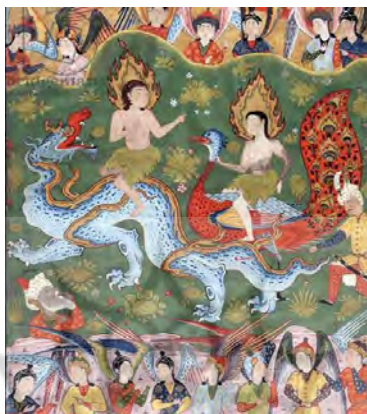
تصویر ۱۱. هبوط آدم و حوا، کتاب فالنامه ، جعفرالصدیق، ۱۵۵۰ م

تصویر ۱۰ از کتاب زبده التواریخ است. این کتاب چهل نقاشی تذهیبی دارد و مربوط به هنر دوره عثمانی است. اما به طور کلی کتاب تحت تأثیر نقاشی‌های مینیاتور شرق ایران قرار دارد (آن راس، ۱۳۹۵: ۱۸-۲۱). در این اثر، آدم و حوا هر دو در حالی که به صورت مساوی از عنصر قدسی بودن (هاله نور) برخوردارند، در حال مؤاخذه شدن در پیشگاه فرشته مقرب الهی هستند، بدون آنکه نقاش از نشانه‌ای برای گناهکاری ویژه حوا استفاده کرده باشد.