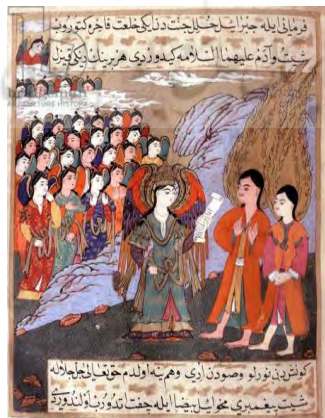
تصویر ۱۰. اخراج آدم و حوا از بهشت توسط جبرئیل؛ کتاب زبدة التواریخ؛ موزه هنرهای ترکی اسلامی، استانبول. ۱۵۳۸ م