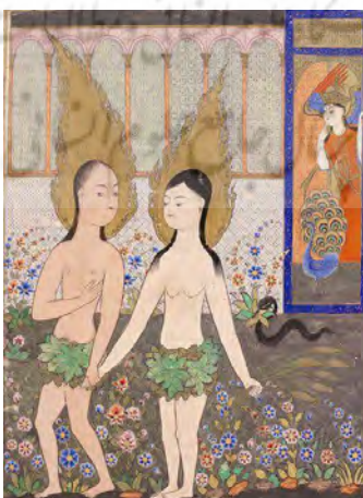
تصویر ۳. اخراج آدم و حوا از بهشت؛ نقاش عراقی (نامشخص)؛ موزه Topkapi Palace. ترکیه، استانبول. ۱۶۱۰ م