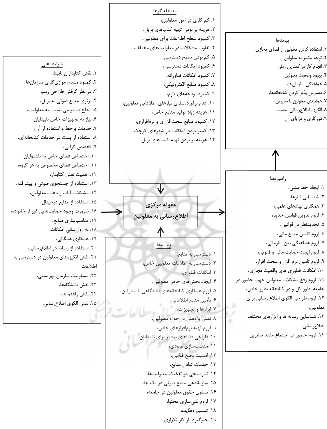
شکل ۳. مدل پارادایم اصلی نقش کتابخانه‌های عمومی در اطلاع‌رسانی به معلولین

سرانجام پیامدهای این امر می‌تواند موارد بهبود وضعیت معلولین، هماهنگی سازمان‌ها، دسترس پذیر کردن کتابخانه‌ها، همانندی معلولین با سایرین، الگوی اطلاع‌رسانی مناسب، دورکاری و مزایای آن باشد.