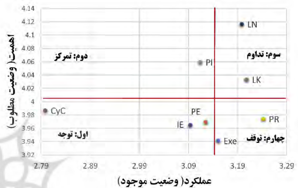
شکل ۱) ماتریس اهمیت-عملکرد توانمندی‌های فناورانه صنایع پایین دست پتروشیمی

تحلیل ماتریس اهمیت-عملکرد توانمندی‌های فناورانه صنایع پایین دست پتروشیمی در شکل ۱ ابتدا از چارک چهارم (ناحیه توقف) شروع و به سمت تحلیل چارک اول (ناحیه توجه) می‌رسد.