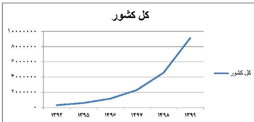
نمودار (۳-۳) اشتغال تعاونی‌های کشاورزی فعال طی سال‌های ۱۳۹۹-۱۳۹۴