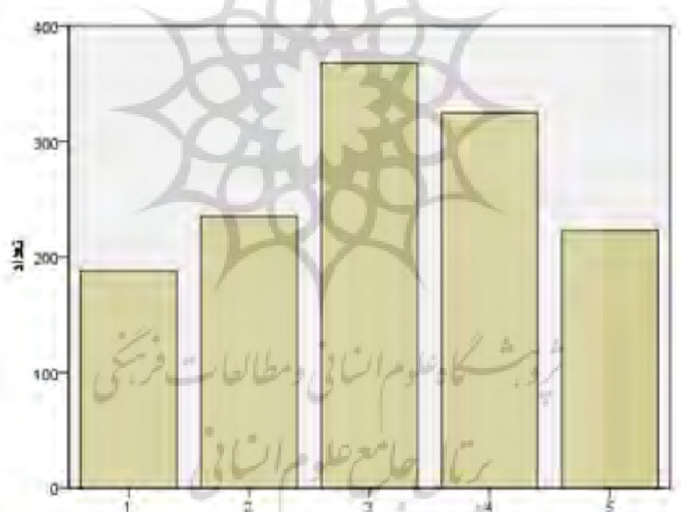
نمودار ۲. بافت‌نگار آرای مخاطبان به تأثیر تلفظ‌پذیری در تکرار نویسه

همچنین، در نمودار ۲ میزان آرای مخاطبان به تأثیر تلفظ‌پذیری تکرار نویسه‌ها در نام‌های تجاری و جملات تبلیغی بر اساس طیف لیکرت با مقیاس ۱ تا ۵ آورده شده است. همان‌طور که مشاهده می‌شود، فرضیه تأثیر تلفظ‌پذیری تکرار نویسه در نام‌های تجاری و جملات تبلیغی در تأثیر بر مخاطب تأیید می‌شود.