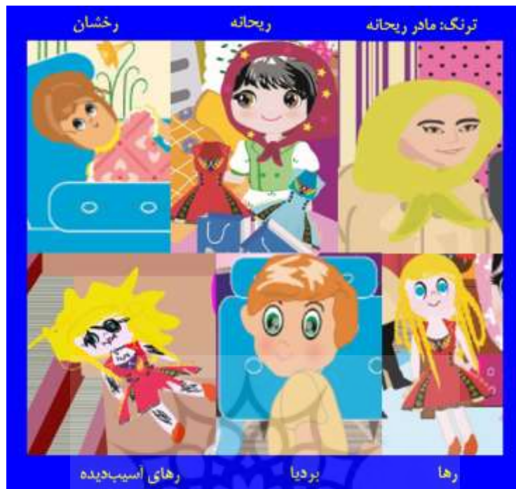
شکل ۱: معرفی شخصیت‌های داستان گلابتون

بی‌جان بودن، با صرف هزینه به روز اول خود برمی‌گردد؛ اما روی دادن چنین اتفاقی برای یک انسان ممکن است تبعات جبران‌ناپذیری داشته باشد و پیامدهای جلوه‌گری، روزی در زندگی فرد جلوه‌گر، نمایان خواهد شد.