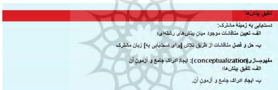
شکل شماره ۲

آنچه که برای توصیف مکانیسم گفتگو و تلفیق در این دو نمونه اهمیت دارد، کیفیت کشف چالش‌های طرفینی در مطالعات تطبیقی قرآن و عهدین و در مرحله بعدی، چگونگی دستیابی به زبان مشترک برای به وجود آوردن هم‌گرایی و مفهومی در بردارنده وجوه مورد نظر در هر دو طرف می‌باشد. این مفهوم نهایی هم‌گرا همان ادراک جامعی است که قریب به اتفاق میان‌رشته‌پژوهان آنرا دست‌آورد و نتیجه میان‌رشته‌ای توصیف کرده بودند.