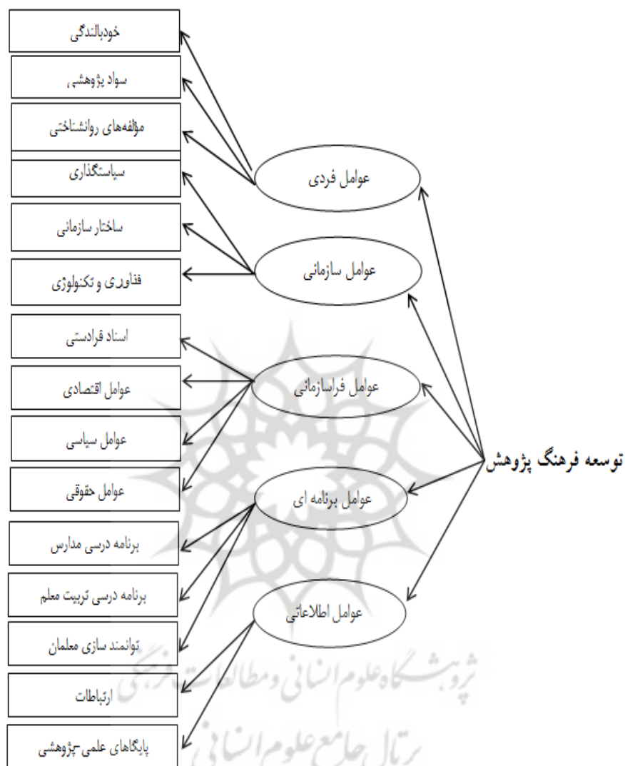
Figure1: Conceptual model of research