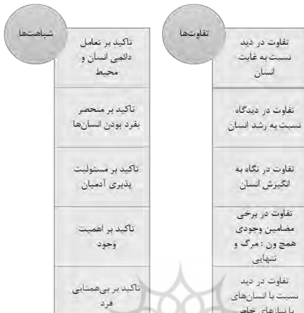
شکل ۳: شباهت‌ها و تفاوت‌های درمان وجودی و مبانی روان‌شناختی تربیت رسمی و عمومی