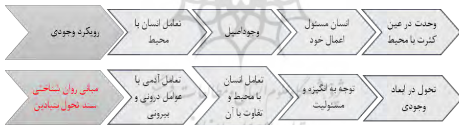
شکل ۲: مهم‌ترین مضامین روان‌شناختی موجود در رویکرد وجودی و مبانی روان‌شناختی تربیت رسمی و عمومی

در ادامه، اهم مضامین رویکرد وجودی و مبانی روان‌شناختی تربیت رسمی و عمومی در قالب شکل ۲، بیان شده است: