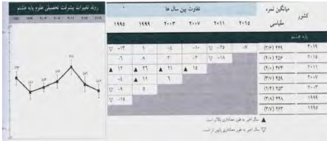
جدول شماره ۲- روند تغییرات پیرفت تحصیلی علم پایه هشتم