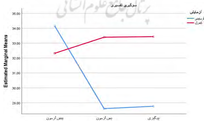
شکل ۱. نمودار میانگین‌های گروه‌های آزمایش و گواه در سه مرحله (سوگیری تفسیری)

نتایج جدول ۳ نشان می‌دهد که مداخله مبتنی بر درمان رفتاری شناختی بر نمره سوگیری تفسیری ( F=258/602, P=0/001 ) با اندازه اثر ۰/۸۴، فراهیجان مثبت ( F=120/709, P=0/001 ) با اندازه اثر ۰/۷۱ و فراهیجان منفی ( F=56/798, P=0/001 ) با اندازه اثر ۰/۵۴ مؤثر بوده است.