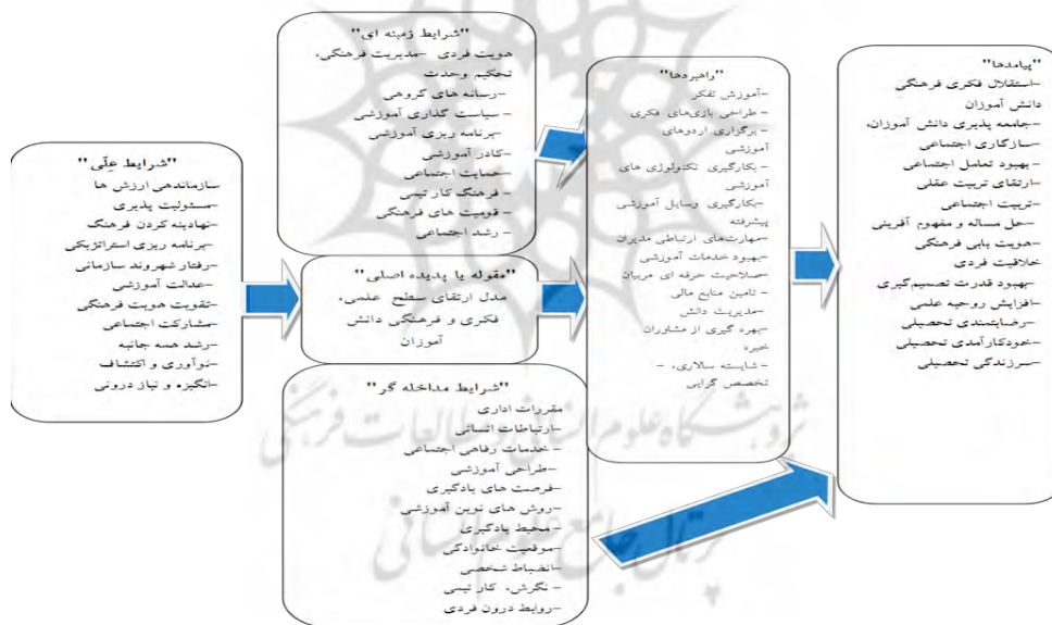
شکل ۱. مدل پارادایمی ارتقای سطح علمی، فکری و فرهنگی دانش‌آموزان در کانون‌های فرهنگی - تربیتی کمیته امداد

مدل ارتقای سطح علمی، فکری و فرهنگی دانش‌آموزان کانون‌های فرهنگی - تربیتی کمیته امداد چگونه است؟