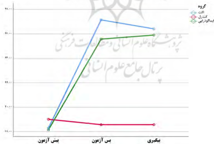
نمودار ۲ نمودار سری زمانی متغیر ارزیابی مجدد