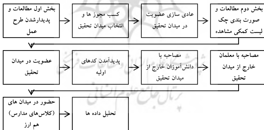
شکل ۱. فرایند مرحله به مرحله اجرای پژوهش

فرایند مرحله به مرحله این مطالعه را در شکل ۱ ملاحظه می‌کنید.