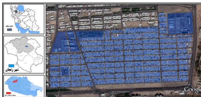
شکل ۲. موقعیت محلہ اسلام آباد در شهر زنجان و کشور

محلہ اسلام آباد در بخش شمال غربی شهر زنجان قرار دارد. این محلہ دارای ۳۵۸۲۰ نفر جمعیت، با مساحت ۱۹۵۱۳۰۰ مترمربع و تراکم ۱۸۳/۶ نفر در هکتار می‌باشد. گفتنی است که اسلام آباد ۳/۲ درصد از مساحت شهر را شامل می‌شود. در حالی که ۱۰ درصد از جمعیت شهر را در خود جای داده است. علاوه بر این، محلہ اسلام آباد، وضعیت امنیتی مطلوب و قابل قبولی ندارد. به طوری که ۳۲ درصد (فقره ۱۴۵۴۹) جرائم شهر در این محلہ روی داده است، از این میزان، مفاسد اجتماعی ۲۷/۶۹ درصد (۴۰۲۸ فقره)، سرقت ۸/۶۹ درصد (۱۲۶۵ فقره)، نزاع و درگیری ۲۷/۷۳ درصد (۴۰۳۴ فقره)، اختلافات خانوادگی ۴/۳۷ درصد (۶۳۶ فقره)، جرائم عمومی علیه اشخاص و اموال ۲۲/۷۹ درصد (۳۳۱۵ فقره) بوده است (Sheriffs Office 13, Zanjan City, 2016). آمارهای مذکور نشان دهنده عمق مسائل اجتماعی و امنیتی در این محلہ است. نکته مهم در این است که آمارهای فوق، مربوط به جرائم ثبت شده است. در صورتی که بسیاری از جرائم روی داده در این قبیل محلات به دلیل ترس از عواقب آن و یا طولانی بودن فرآیند رسیدگی، به مراکز امنیتی و کلاتتری‌ها ارجاع داده نمی‌شود. این در حالی است که محلہ اسلام آباد یک محلہ اسکان غیر رسمی است. و شدیداً نیازمند برنامه‌ریزی‌ها و پروژه‌های عمرانی و اجتماعی-اقتصادی است. اما این قبیل مسائل نیازمند، مطالبه و تقاضای مردم، دانش و آگاهی آن‌ها و همکاری و یکدلی مردم در مطالبات حقوق شهروندی است.