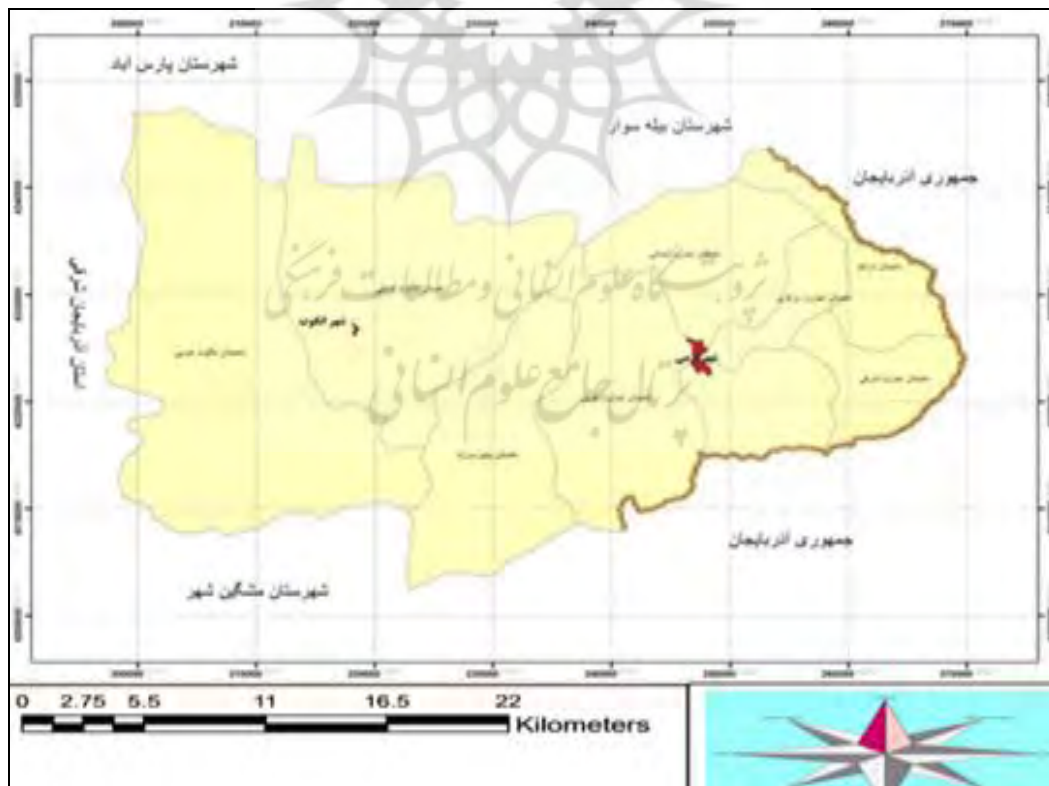
شکل ۱. موقعیت جغرافیایی محدوده مورد مطالعه

همان‌طوری که شکل (۱) نشان می‌دهد شهرستان گرمی در شمال غرب کشور جمهوری اسلامی ایران، در شمال شرق استان اردبیل بین ۳۸ درجه و ۵۰ دقیقه تا ۳۹ درجه و ۱۰ دقیقه عرض شمالی از خط استوا و ۴۷ درجه و ۲۵ دقیقه تا ۴۸ درجه و ۱۲ دقیقه طول شرقی از نصف النهار گرینویچ واقع شده است. شهرستان گرمی از شمال به شهرستان‌های بیله سوار و پارس‌آباد مغان، از جنوب به شهرستان مشکین شهر و جمهوری آذربایجان، از شرق به جمهوری آذربایجان و از غرب به شهرستان‌های کلیبر و اهر در استان آذربایجان شرقی محدود است.