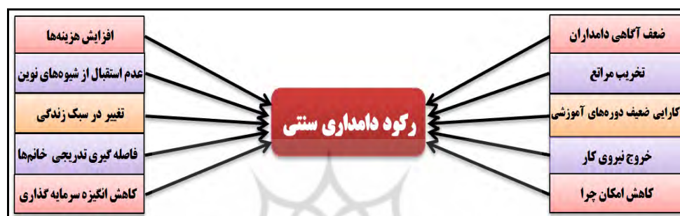
شکل ۱. موارد مورد بررسی بر رکود دامداری سنتی در دو ناحیه مورد مطالعه

تمایل غیر منطقی به افزایش دام اهلی خوددارند. دلیل اصلی این امر تمایل به افزایش درآمد حاصل از دامداری بدون توجه به وضعیت مراتع است اما در مواردی این بی‌توجهی منجر به رکود آن می‌گردد. پاربخ ۱ و همکاران (۱۹۹۷) نشان دادند که نوسانات آب و هوایی همراه با افزایش میزان نرخ دام‌گذاری به شدت افت درآمد را افزایش می‌دهد. درآمد پایین در چرخه‌ی تولید دام به استرس برای تولیدکنندگان کشاورزی و خانواده‌های آنها که با افزایش فشارهای مالی و احتمال شکست در کسب و کار روبرو هستند منجر می‌شود. نگلر ۲ و همکاران (۲۰۰۷) علاوه بر استراتژی‌های انحلال جزئی گله و خرید اضافی علوفه، استراتژی‌های از شیر گرفتن زودرس، فروش دام‌های جوان نگه‌داشته شده و نقد کردن کلی گله را برای مقابله با کمبود علوفه در ارتباط با خشک‌سالی مورد ارزیابی قرار داده‌اند. به گزارش کالیونیمی ۳ و همکاران در فنلاند (۲۰۱۱)، عامل ۷۷ درصد از حوادث در زنان روستایی، کار با حیوانات خانگی بوده و از حرکات غیره منتظره حیوان مثلاً هنگام دوشیدن شیر، به‌عنوان اصلی‌ترین خطر کار با حیوانات یادشده است (Kallioniemi et al., 2011).