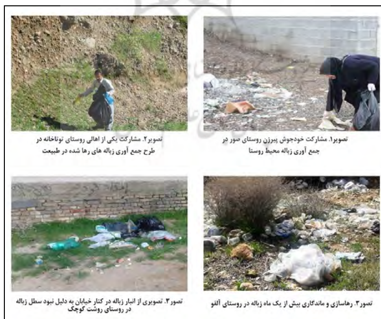
شکل ۳. وضعیت محیط زیست در دو گروه از روستاهای گردشگرپذیر و فاقد گردشگری

به منظور تبیین دقیق وجود تفاوت در دانش و آگاهی‌های زیست محیطی روستاهای گردشگرپذیر در مقایسه با روستاهای فاقد گردشگری و همچنین به منظور درک هرچه بیشتر نتایج آزمون‌های آماری، عکس‌های مرتبط با هر دو گروه از روستاها آورده شده است.