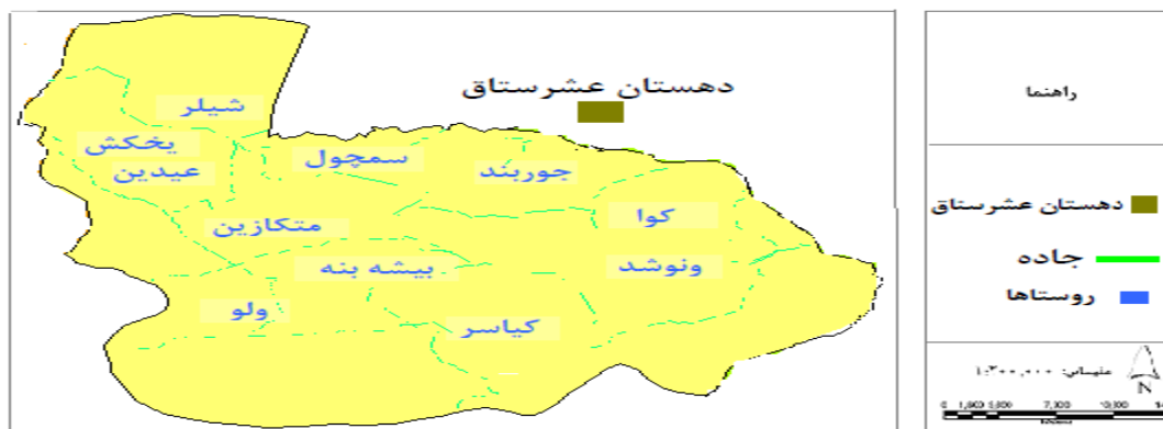
شکل ۳. روستاهای مورد مطالعه