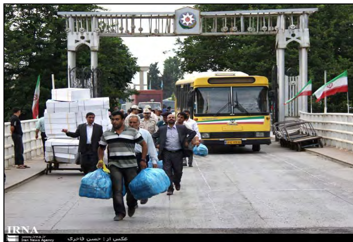
شکل ۲. نمایی از مشارکت روستاییان در تجارت چمدانی در گمرک آستارا