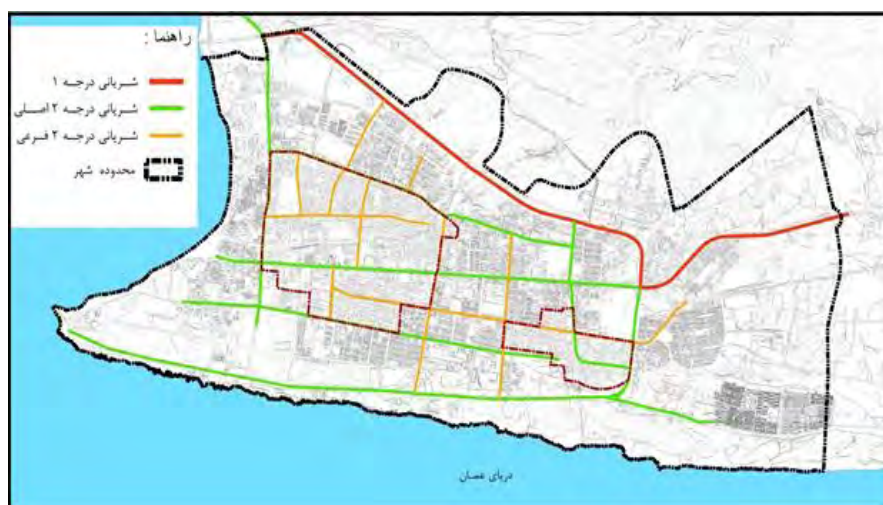
شکل ۲. سلسله مراتبی شبکه ارتباطی شهر چابهار