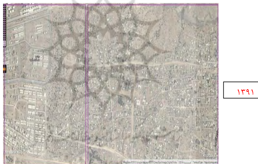
شکل ۴. روند گسترش اسکان غیررسمی در سال ۱۳۹۱-۱۳۸۴

شکل (۴) گسترش اسکان غیررسمی را در شهر چابهار طی سال‌های ۱۳۸۴ تا ۱۳۹۱ نشان می‌دهد. در واقع بررسی تصاویر هوایی و مشاهدات میدانی، بیانگر این است که شکل‌گیری اسکان غیررسمی روندی روبه گسترش داشته است، و سکونت در این محدوده با تصرف غیرقانونی زمین همراه بوده است. تصاویر هوایی نشان می‌دهد که شکل‌گیری اسکان غیررسمی متصل به محدوده شهری شهر چابهار انجام گرفته است. با توجه به موقعیت شهر چابهار که از دو طرف به دریا منتهی می‌شود و امکان گسترش را ندارد، و از طرفی دیگر کوه‌های تیس و اراضی منطقه آزاد مانع گسترش شهر به آن سو می‌باشند، به عبارتی تنها جهت گسترش آتی شهر به طرف شرق چابهار می‌باشد، که باز هم با مشکل شکل‌گیری سکونتگاه‌های غیررسمی مواجه می‌باشد.