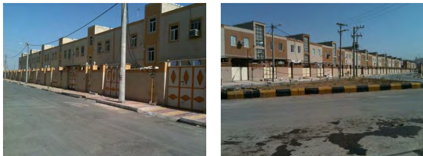
شکل ۳. نمایشی از وضعیت کالبدی مسکن مهر شهر امیدیه