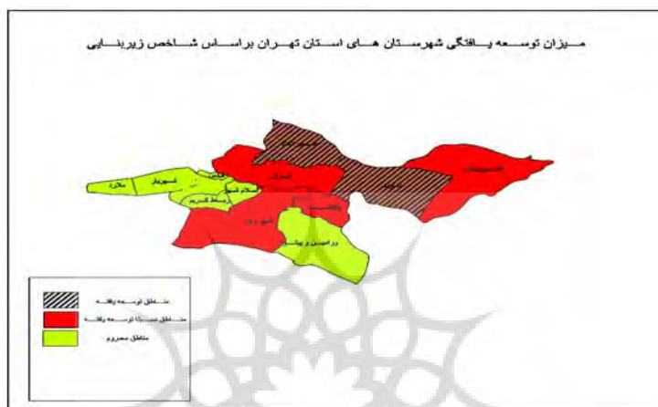
شکل ۵. درجه توسعه‌یافتگی شهرستان‌های استان تهران براساس شاخص زیربنایی

چهارمین بخش، بخش زیربنایی است که در استان مورد بررسی قرار گرفته است، نتایج بدست آمده از توسعه‌یافتگی شهرستان‌های شمیرانات و دماوند نشان دارد، ۴ شهرستان تهران، فیروزکوه، پاکدشت و شهر ری نیز نسبتاً توسعه یافته هستند و ۷ شهرستان نیز در وضعیت محروم و کم توسعه قرار دارند. شهرستان شمیرانات نیز در این بخش با امتیاز ۰.۴۲۸۷ توسعه یافته‌ترین شهرستان استان است و شهرستان ملارد نیز با امتیاز ۰.۹۸۴۳ محروم‌ترین شهرستان استان است. این بخش با اینکه باید دارای اولویت در سیاستگذاری‌ها باشد و مورد بررسی‌های اساسی قرار گیرد. ولی نتایج بدست آمده حاکی از آن است که به این بخش توجه کمی شده و در نتیجه این امر مسایل و مشکلاتی در دیگر بخش‌ها ایجاد شده است.