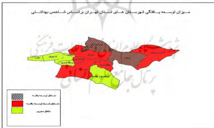
شکل ۴. درجه توسعه یافتگی شهرستان‌های استان تهران براساس شاخص بهداشتی

در بخش بهداشتی تنها دو شهرستان شمیرانات و دماوند در وضعیت توسعه یافته‌ای قرار دارند و ۵ شهرستان نیز وضعیت نسبتاً توسعه یافته‌ای قرار دارد و ۶ شهرستان هم در وضعیت محروم قرار دارند. شهرستان تهران در وضعیت نسبتاً توسعه یافته قرار گرفته است. شهرستان شمیرانات توسعه یافته‌ترین شهرستان استان با امتیاز ۰.۴۷۹۸ می‌باشد و شهرستان ملارد نیز با امتیاز ۰.۹۹۰۱ محروم‌ترین شهرستان استان را شامل می‌گردد. وضعیت شاخص‌های بهداشتی وضعیت نامناسبی را در استان نشان می‌دهد و مسئولان باید گام‌های اساسی را در این راستا بردارند.