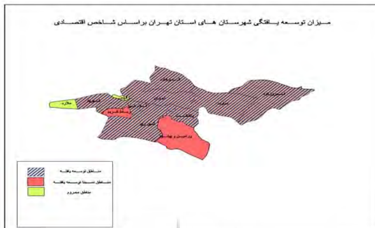
شکل ۳. درجه توسعه یافتگی شهرستان‌های استان تهران براساس شاخص اقتصادی

در بخش اقتصادی، استان وضعیت مناسبی دارد و ۸ استان در وضعیت توسعه یافته‌ای قرار دارد و ۳ شهرستان نیز در وضعیت نیمه توسعه یافته‌ای قرار دارد و ۲ شهرستان قدس و ملارد نیز در وضعیت محرومی قرار دارند. در این بخش، شهر ری با امتیاز ۰.۴۷۹۸ توسعه یافته ترین شهرستان استان است و شهر قدس نیز محروم‌ترین شهرستان استان است.