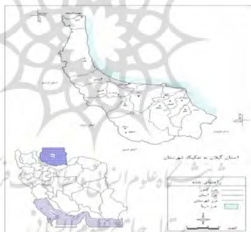
شکل ۳. جایگاه محدوده مورد مطالعه در تقسیمات کشوری

استان گیلان با ۱۴۰۴۲/۳ کیلومتر مربع مساحت، در شمال ایران و در جنوب غربی دریای خزر واقع شده است و از نظر موقعیت ریاضی در محدوده ۳۶ درجه و ۳۴ دقیقه الی ۳۸ درجه و ۲۷ دقیقه عرض شمالی و ۴۸ درجه و ۵۳ دقیقه الی ۵۰ درجه و ۳۴ دقیقه طول شرقی از نصف النهار گرینویچ قرار دارد. استان گیلان از شمال غربی به جنوب شرقی ۲۳۵ کیلومتر طول و پهنای آن ۲۵ تا ۱۰۵ کیلومتر می‌باشد. گیلان از شمال به دریای خزر و کشور آذربایجان، از غرب و شمال غربی به استان اردبیل، از غرب به استان زنجان، از جنوب به استان قزوین و از شرق به استان مازندران محدود می‌شود. استان گیلان بر اساس آخرین تقسیمات کشوری (۱۳۸۵)، دارای ۱۶ شهرستان، ۴۳ بخش، ۴۹ شهر، ۵۶ دهستان ۲۹۳۵ آبادی ( ۲۶۹۴ آبادی دارای سکنه و ۲۴۱ آبادی خالی از سکنه) می‌باشد (معاونت و برنامه‌ریزی استانداری گیلان، ۱۳۸۶: ۵۸).