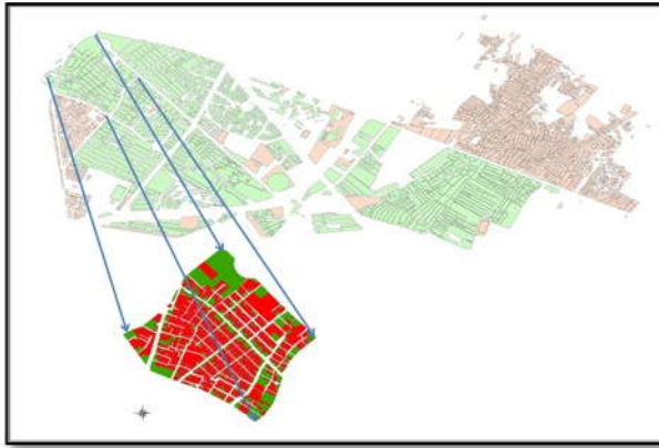
شکل ۱. موقعیت محله چهنو در منطقه ۶