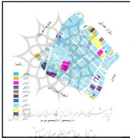
شکل ۲. وضع موجود محله چهنو

محله چهنو یکی از محلات قدیمی با بافت مسکونی نسبتاً فرسوده منطقه ۶ مشهد می‌باشد که در قسمت غربی منطقه واقع شده است. با توجه به اینکه منطقه ۶ محله‌بندی نشده است، تفکیک و تعریف مرز این محله به صورت عرفی و توسط دسترسی‌های فرعی و اصلی می‌باشد. این محله از شمال غرب به دسترسی اصلی هفده شهروار، از شمال شرق به دسترسی اصلی بلوار مصلی، از جنوب غرب با دسترس فرعی شیروودی و از جنوب شرق با دسترسی فرعی چمن محدود شده است. مساحت محله ۴۱/۶۲۷ هکتار، جمعیت کل محدوده ۱۰۳۷۸ نفر که ۵۲۷۷ نفر آن مرد و ۵۱۰۱ نفر زن می‌باشند.