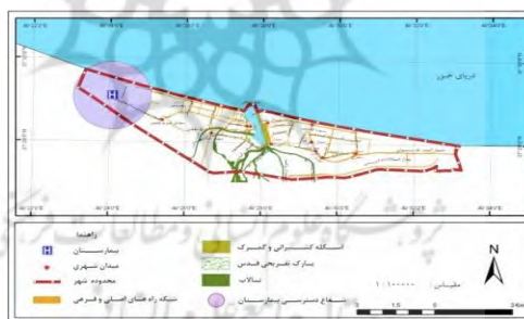
شکل ۲. شعاع دسترسی بیمارستان شهر انزلی

شعاع دسترسی استاندارد بیمارستان ۱ تا ۱/۵ کیلومتر و درمانگاه‌ها ۶۵۰ تا ۷۵۰ متر می‌باشد. شعاع دسترسی مراکز بهداشت و پایگاه‌های بهداشتی بر اساس جمعیت مشخص می‌شود، انزلی با داشتن یک بیمارستان علاوه بر جمعیت کل شهرستان جمعیت رضوانشهر را تحت پوشش قرار می‌دهد. بنابراین همه شهروندان نمی‌توانند از شعاع استاندارد ۱ تا ۱/۵ کیلومتر برخوردار باشند، همان‌طور که در شکل (۲) مشاهده می‌شود ساکنین بخش شرقی، مرکزی، شمال و جنوب شرقی حتی قسمتی از بخش غربی شهر باید بیشتر از ۱/۵ کیلومتر طی کنند تا به بیمارستان برسند، از این رو با توجه به کل جمعیت تحت پوشش، حداقل باید بیمارستان انزلی را از لحاظ تجهیزات پزشکی و پزشکان متخصص تقویت نمود تا بتواند جمعیت مذکور را به خوبی سرویس دهد. درمانگاه‌های شهر همان‌طور که گفته شد در بخش شرقی و مرکزی شهر مستقر بوده از این رو تا شعاع ۷۵۰ متر اطراف خود را به راحتی پوشش می‌دهد، همان‌طور که در شکل (۳) می‌بینیم فقط دو درمانگاه رازی و فاطیما همدیگر را پوشش می‌دهند.