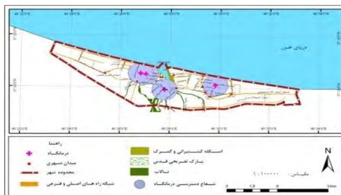
شکل ۳. شعاع دسترسی درمانگاه‌های شهر انزلی